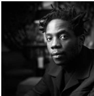
Makita Samba Comédien, metteur en scène de théâtre, nommé pour le César du meilleur espoir masculin dans Les Olympiades de Jacques Audiard.