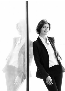
Irène Jacob Comédienne de cinéma et de théâtre.

Lit Bonjour tristesse de Françoise Sagan