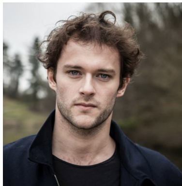
Maxime Taffanel Comédien et metteur en scène de théâtre.