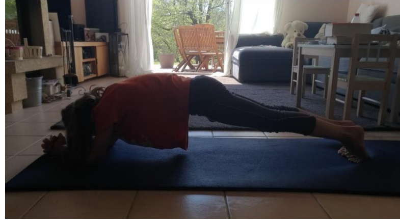
Défi : Gainage