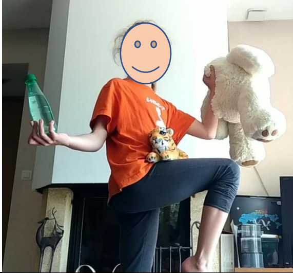
Défi : équilibre