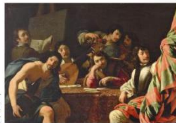
Doc. 4 Eustache Le Sueur (1617-1655), Rassemblement d'amis , 1640. Huile sur canevas, 127 x 195 cm, musée du Louvre, Paris.