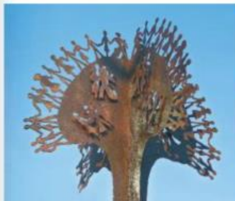
Doc. 3 Bernard Magès, L'Arbre de l'amitié , 2013. Sculpture en acier, 100 x 100 cm, œuvre réalisée pour célébrer le 50 e anniversaire du traité d'amitié entre la France et l'Allemagne.