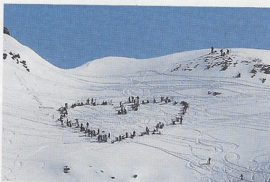
Pour afficher leur attachement à ce coin de montagne sauvage, les manifestants ont formé symboliquement un cœur dans le vallon.

« Je suis surpris par la diversité des personnes qui manifestent. Il y a des gardiens, des guides, [...] des défenseurs de la faune et de la flore, et même des moniteurs de ski de la station qui veulent préserver ce paysage. [...] »