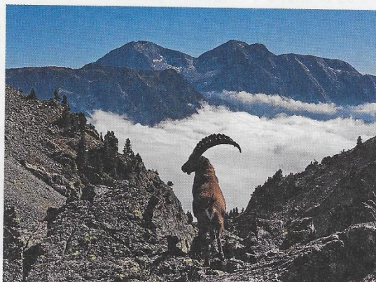
Un bouquetin dans le vallon des Vans.

Hélène [...] s'émerveille de la richesse du site :