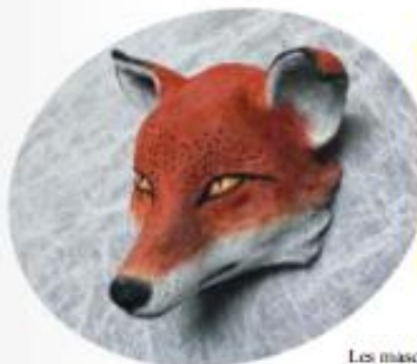
Les masques photographiés sont de Loïc Nebreda.

Le masque n'est pas un simple accessoire, mais une véritable source d'inspiration pour les metteurs en scène et les comédiens. Sculpter un masque, c'est déjà inventer un langage !