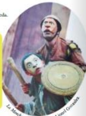
Le Ménéchme, mise en scène Lionel Goussier

Qu'il soit masque de comédie ou de tragédie, humain ou animalier, le masque est fabriqué pour prendre vie, être utilisé sur scène, et non pour rester accroché au mur. Il ne cache pas mais révèle le corps du comédien. C'est là tout le talent du créateur de masques.