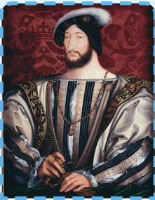
F rançois 1 er