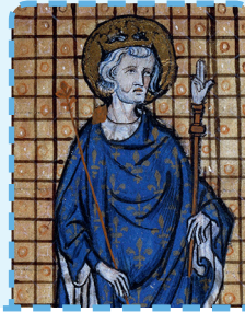
L ouis IX