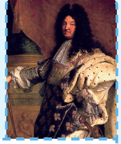
L ouis XIV