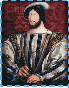
F rançois 1 er