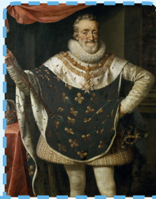
H enri IV