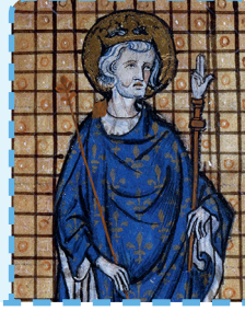
L ouis IX