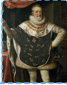
H enri IV