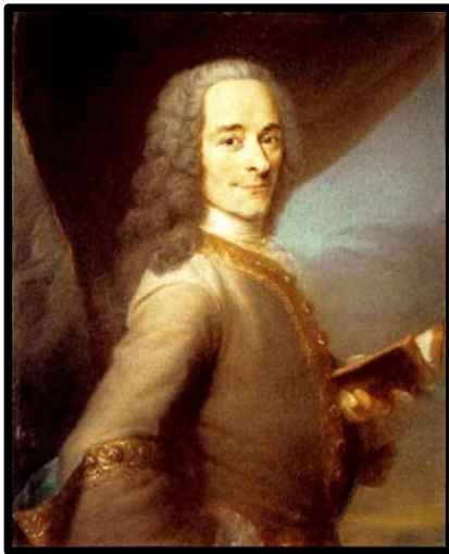
François-Marie Arouet, dit Voltaire

En 1748, il publie De l'esprit des Lois . Il y définit la séparation des pouvoirs. Ces conceptions ont contribué à définir le principe des démocraties occidentales.