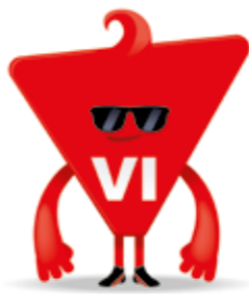
verbe à l'infinitif