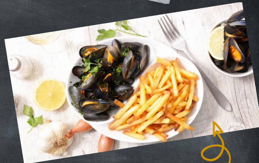
Les moules et frites