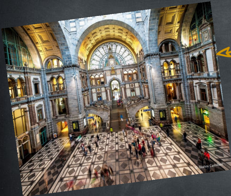
La gare centrale