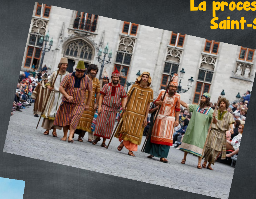
La procession du Saint-Sang