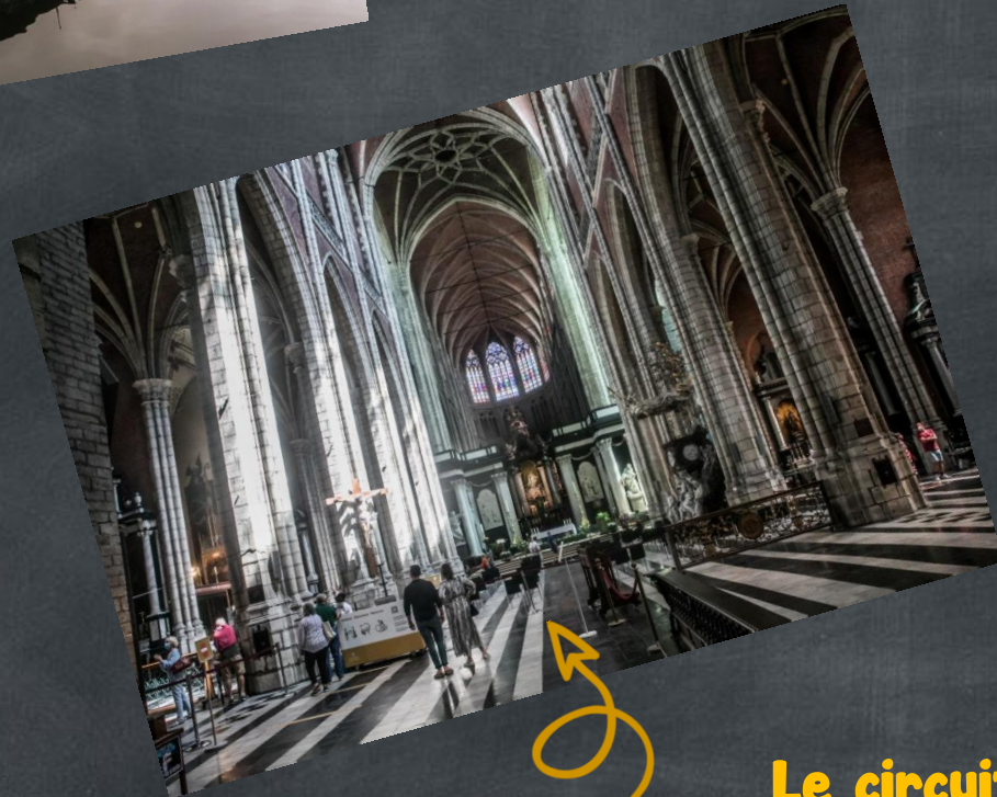
La Cathédrale Saint-Bavon