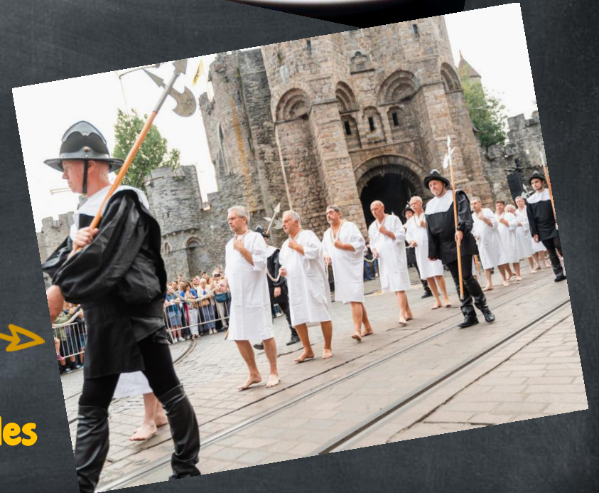
Le circuit Charles Quint