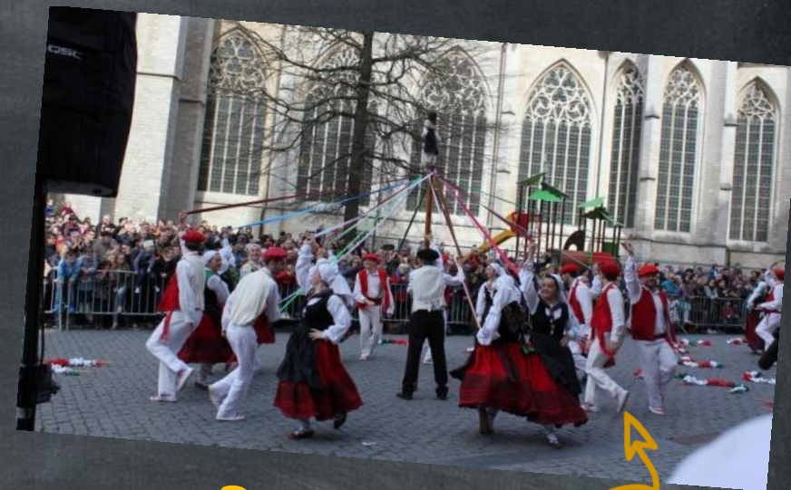
« Paasfeesten »