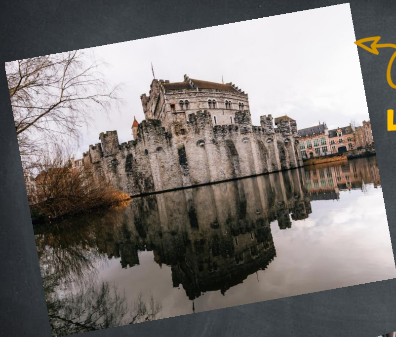
Le château des Comtes