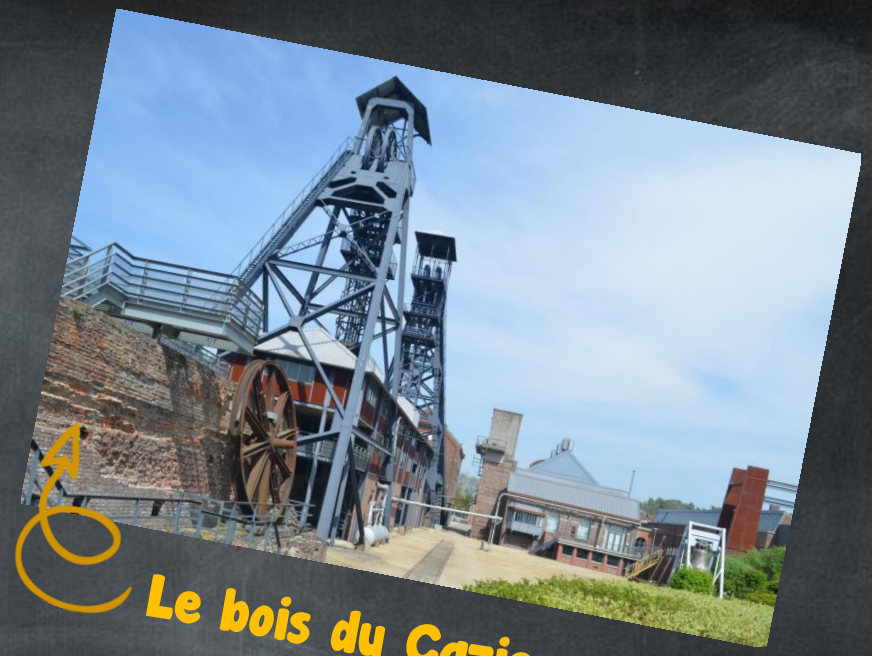
Le bois du Cazier