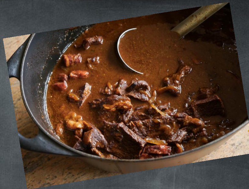
La carbonnade à la flamande