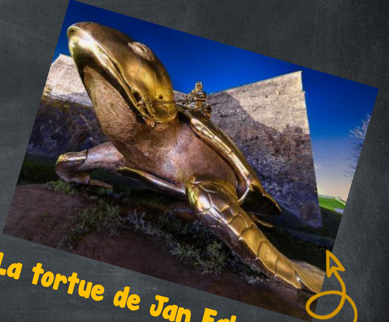
La tortue de Jan Fabre