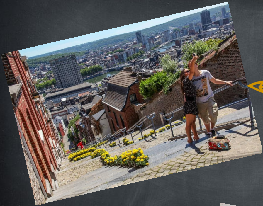
La montagne de Bueren