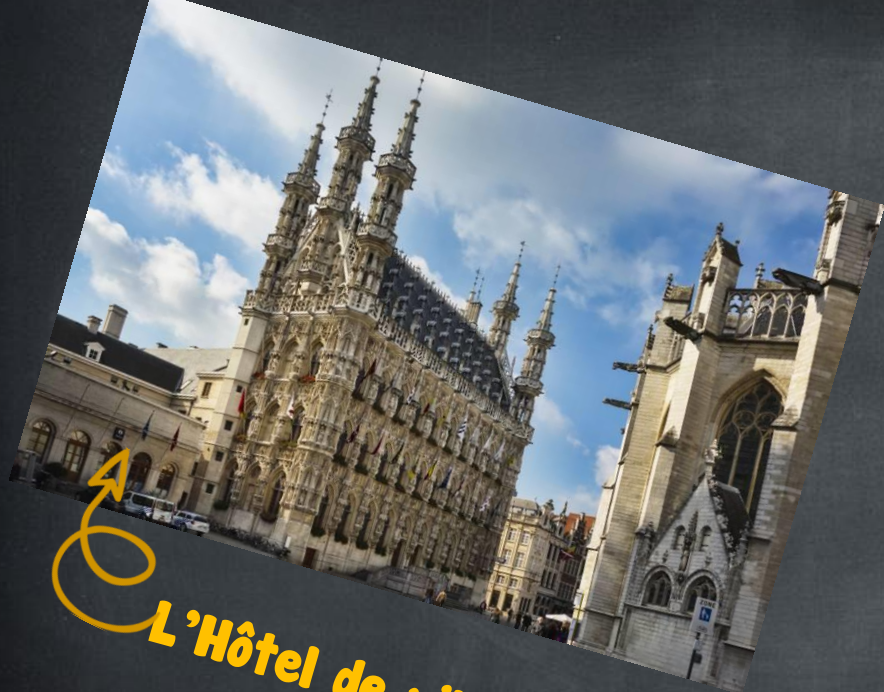
L'Hôtel de ville