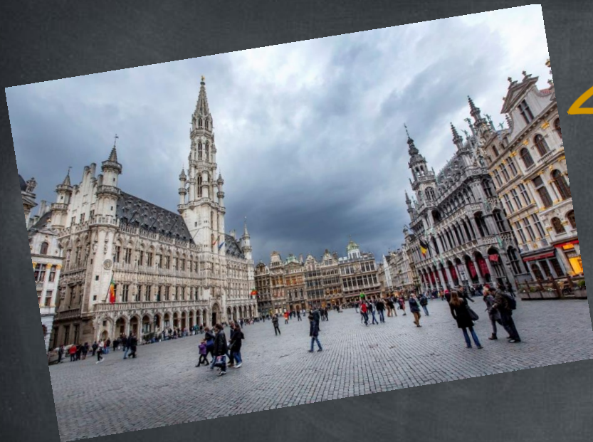
La Grand Place