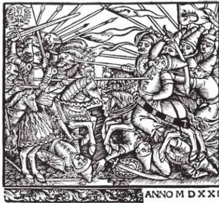
Битва с татарами. Гравюра XVI в.

Руководство Великого Княжества Литовского пыталось разорвать союз Крыма с Москвой и даже направить татарские набеги на земли Московского государства. Для этого использовались различные средства, в том числе богатые подарки хану и его сановникам. Но сделать это удавалось не всегда. В первой половине на южных территориях ВКЛ стала налаживаться система постоянной обороны от набегов крымских татар. Но наиболее серьёзную силу в противостоянии Крымскому ханству вскоре стало представлять казачество. С 20-х гг. XVI в. набеги крымских татар стали реже, а с 30-х гг. уже не достигали территории Беларуси.