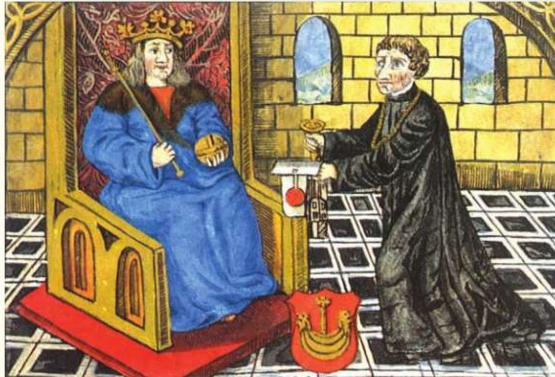
Великий князь литовский Александр. Миниатюра начала XVI в.

Тем не менее отношения между союзными государствами складывались непросто. Польша считала, что именно она будет главенствовать в этом союзе. ВКЛ настаивало на том, что союзники должны иметь равные права. Великое Княжество долгое время упорно и успешно отстаивало свою независимость. Оно имело собственную систему власти и управления, государственную казну и деньги, войско, законы, проводило самостоятельную внешнюю политику. Однако ВКЛ согласовывало с Польшей свои действия в отношении других стран.