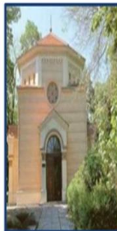
Часовня, скрывающая башню черепов

Милош Обрѐнович — второй вождь Сербии (1815—1817 гг.), князь Сербии в 1817—1839 и 1858—1860 гг., основатель династии Обреновичей. Несмотря на свою неграмотность, он основал 82 школы, 2 прогимназии, 1 гимназию и Лицей Княжества Сербского, который стал фундаментом развития высшего образования. Был самым богатым человеком в Сербии и одним из самых богатых на Балканах.