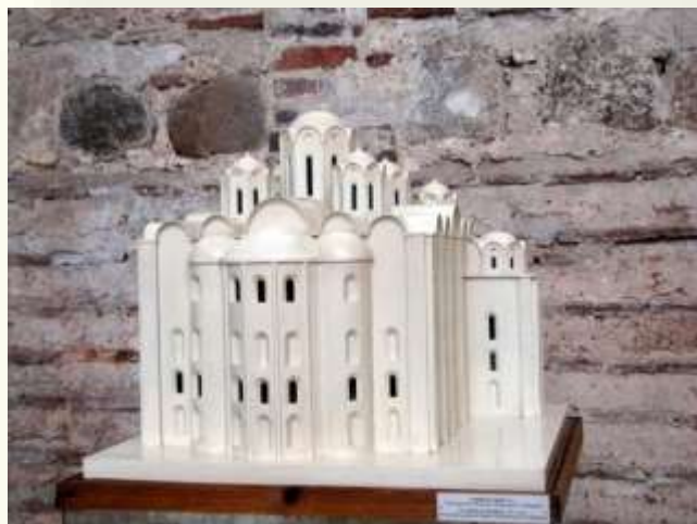
Реконструкция первоначального вида Софийского собора в Полоцке