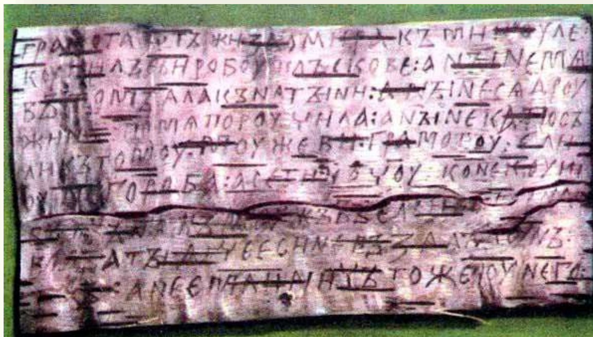
Берестяная грамота из Витебска

В Бресте был найден деревянный гребень для расчёсывания волос с последовательно расположенными на нём буквами славянского алфавита. Исключительную научную ценность имеют берестяные грамоты - берёзовая кора с буквами, нацарапанными на ней. Такие грамоты были найдены археологами в Витебске и Мстиславле. Их содержание говорит о том, что грамотой в то время владели и простые горожане, а их дети обучались грамоте.