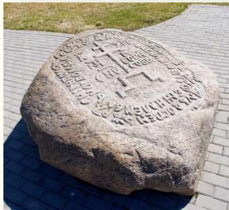
Рогволодов камень. Орша

В XI в. в Полоцкой земле стала распространяться кириллическая азбука, составленная в 863 г. братьями Кириллом и Мефодием. Об этом свидетельствовали, например, надписи на так называемых Борисовых камнях, найденных в русле Западной Двины, а также надпись на Рогволодовом камне возле Орши.