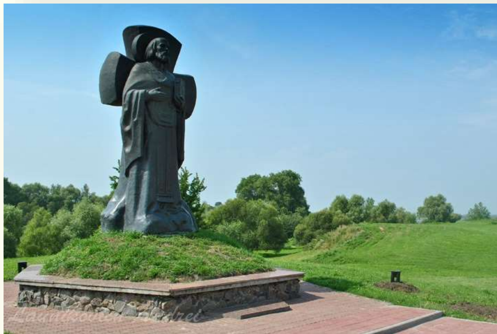
Памятник Кириллу Туровскому. Туров

Выдающимся религиозным просветителем был туровский епископ Кирилл (около 1113 - после 1190). Он замуровался в небольшой монастырской башне (столпе) и жил отшельником - в изоляции от всех людей. Кирилл Туровский не только читал здесь книги, но и писал «слова» - обращения к верующим, а также молитвы-исповеди, повести-притчи, имевшие характер наставления. В этих произведениях он выражал своё отношение к поведению людей с точки зрения христианской морали. За красноречие Кирилла Туровского ещё при жизни прозвали «Златоустом, который паче всех воссиял на Руси».