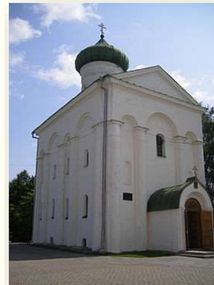
Современный вид Спасо-Ефросиниевской церкви в Полоцке

В период политической раздробленности на белорусских землях выделились полоцкая и гродненская архитектурные школы. Из полоцких церквей до наших дней сохранилась Спасо-Ефросиниевская церковь. Она была построена по заказу Ефросинии Полоцкой для основанного ею женского монастыря. Строительством церкви руководил зодчий Иоанн (Иван). Он придал однокупольной Спасо-Ефросиниевской церкви ярусный вид. Впервые в восточнославянском зодчестве купол церкви был украшен так называемыми кокошниками. Этот новый тип построек является отличительной чертой полоцкой архитектурной школы.