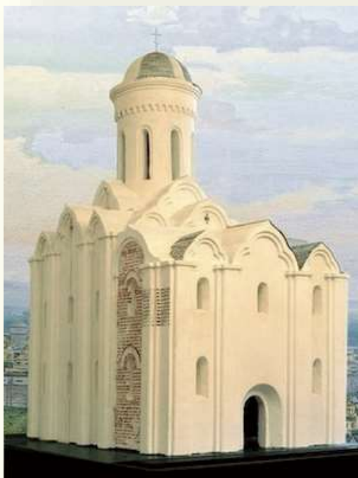
Реконструкция первоначального вида Спасо-Ефросиниевской церкви в Полоцке