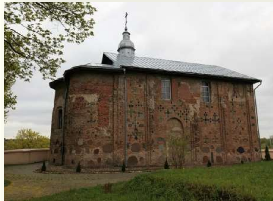
Борисоглебская (Коложская) церковь в Гродно

Выдающимся памятником зодчества XII в. является Борисоглебская (во имя святых Бориса и Глеба) церковь в Гродно. Чаще её называют Коложской церковью, т.к. она была построена в предместье Коложа. Наружные стены церкви украшены камнями разных цветов, а также цветными плитками. Ими выложены разные фигуры. Все это придаёт зданию праздничный вид. Внутри в стены были вмурованы глиняные жбаны-голосники. Благодаря им в церкви лучше звучал голос священника. Коложская церковь является наиболее ярким примером гродненской архитектурной школы зодчества.