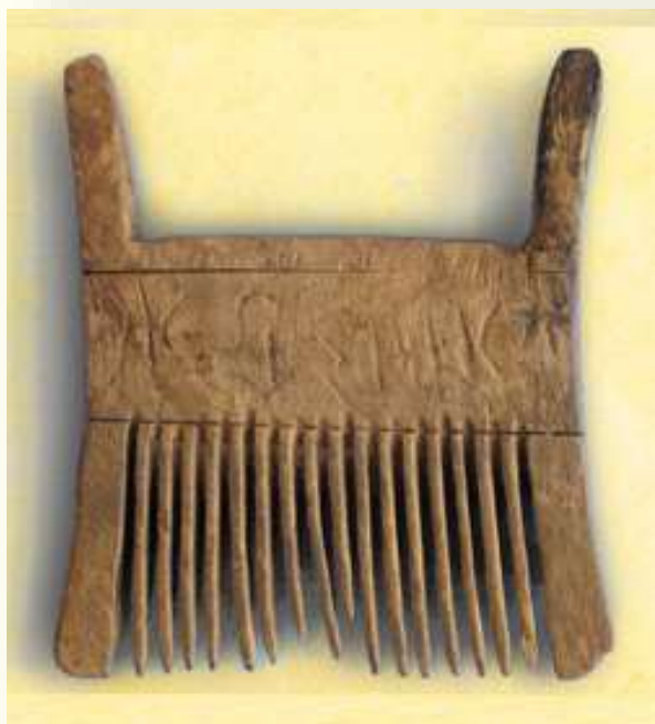
Деревянный гребень из Бреста