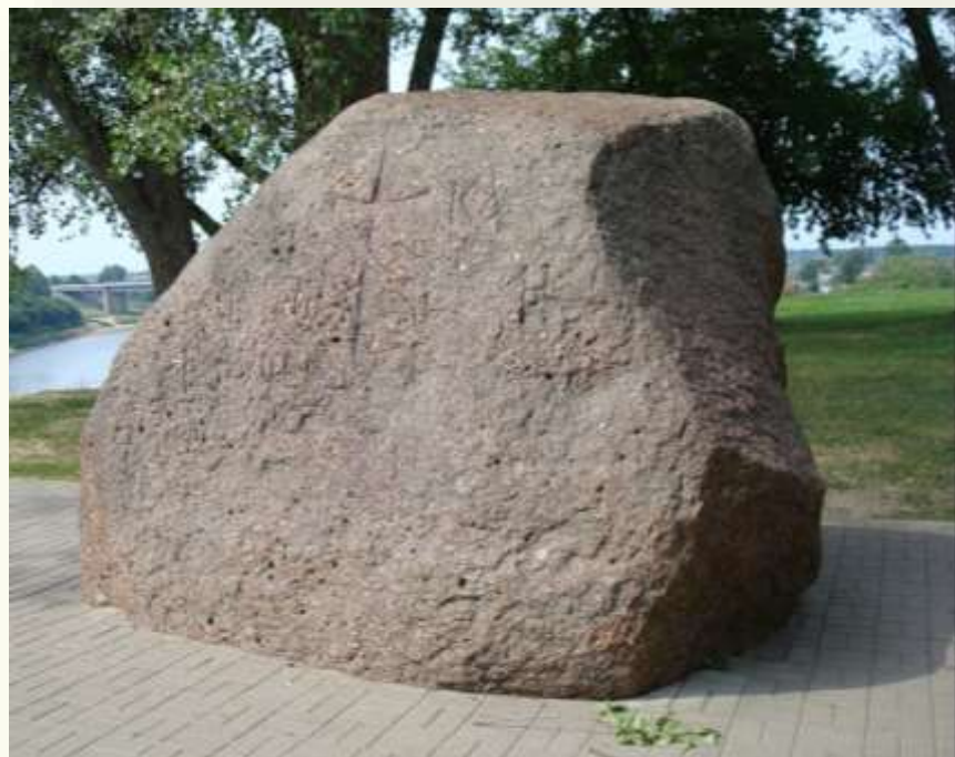
Борисов камень. Полоцк