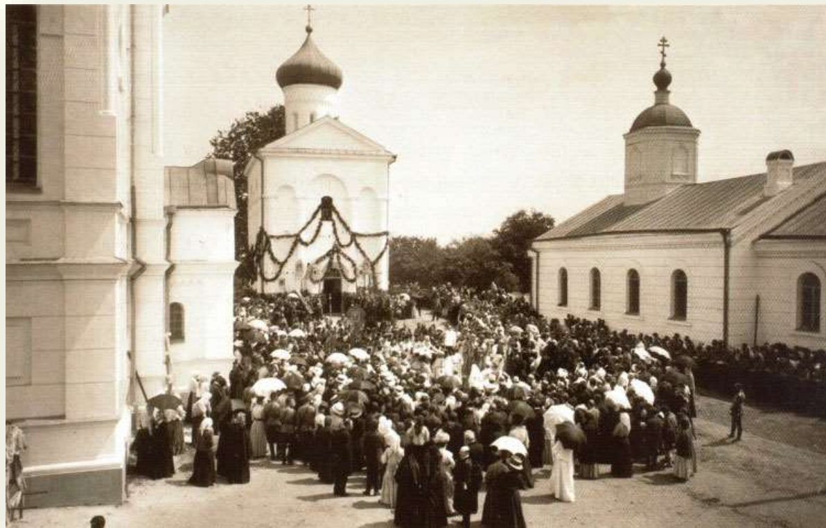
Перенос мощей Ефросинии в Полоцк, 1910 г.

Уже на склоне жизни Ефросиния совершила религиозный подвиг - отправилась в дальнее и тяжёлое путешествие в Святую землю, в Иерусалим, где и умерла. Ефросиния Полоцкая (около 1101? - 1167) - первая из восточнославянских женщин, которую православная церковь провозгласила святой. Верующие считают её небесной заступницей белорусской земли и каждый год 5 июня отмечают день её памяти.