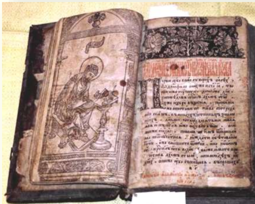
Повесть временных лет

В первой половине XI в. началось летописание - запись событий по годам («летам») в хронологической последовательности. В начале XII в. монахом Нестором была создана «Повесть временных лет» - летопись, содержащая, например, сведения о Рогволоде, Рогнеде, Изяславе, Всеславе Чародее, битве на Немиге и других событиях из истории восточных славян. Есть сведения, что существовала Полоцкая летопись. Но она не сохранилась до наших дней.