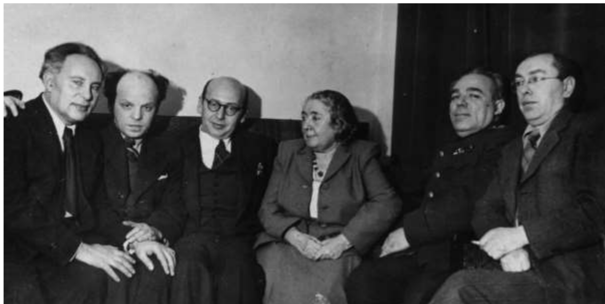
Члены Еврейского антифашистского комитета

В это время репрессиям подвергся Еврейский антифашистский комитет, созданный ещё в годы войны. Его лидеры после окончания войны предлагали создать еврейскую автономию в Крыму или Поволжье. Обвинённые в космополитизме и даже заговоре, они были приговорены на закрытом судебном процессе, состоявшемся в 1952 г., к расстрелу. И только смерть И.В.Сталина 5 марта 1953 г. остановила новые политические репрессии.