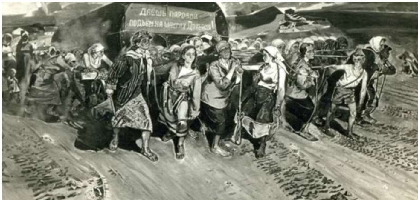
Восстановление шахт Донбасса. Худ. Вл.Сизов

Трудом советских людей в короткие сроки были подняты их руин ДнепрогЭС, шахты Донбасса, возведены машиностроительные гиганты на Урале, отстроены металлургические заводы «Запорожсталь», «Азовсталь», тракторные заводы в Сталинграде и Минске, введены в строй Кубышевская ГЭС, Норильский металлургический комбинат и др.