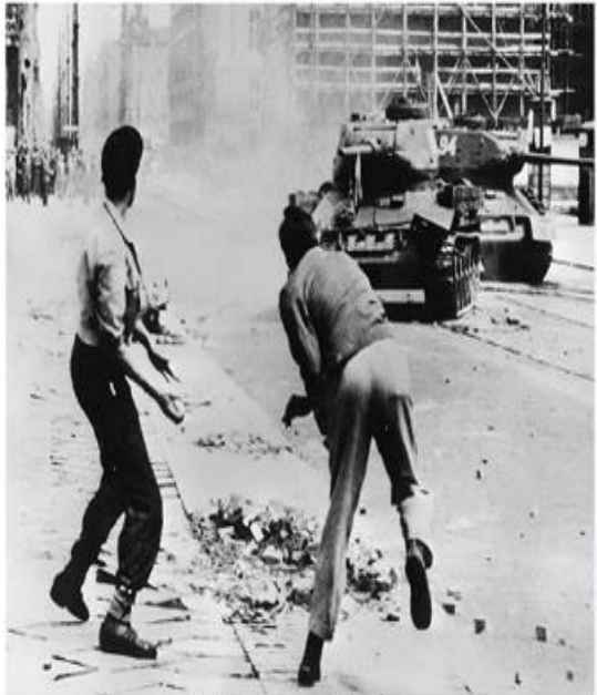
17 июня 1953 года. Берлин, Лейпцигер-штрассе