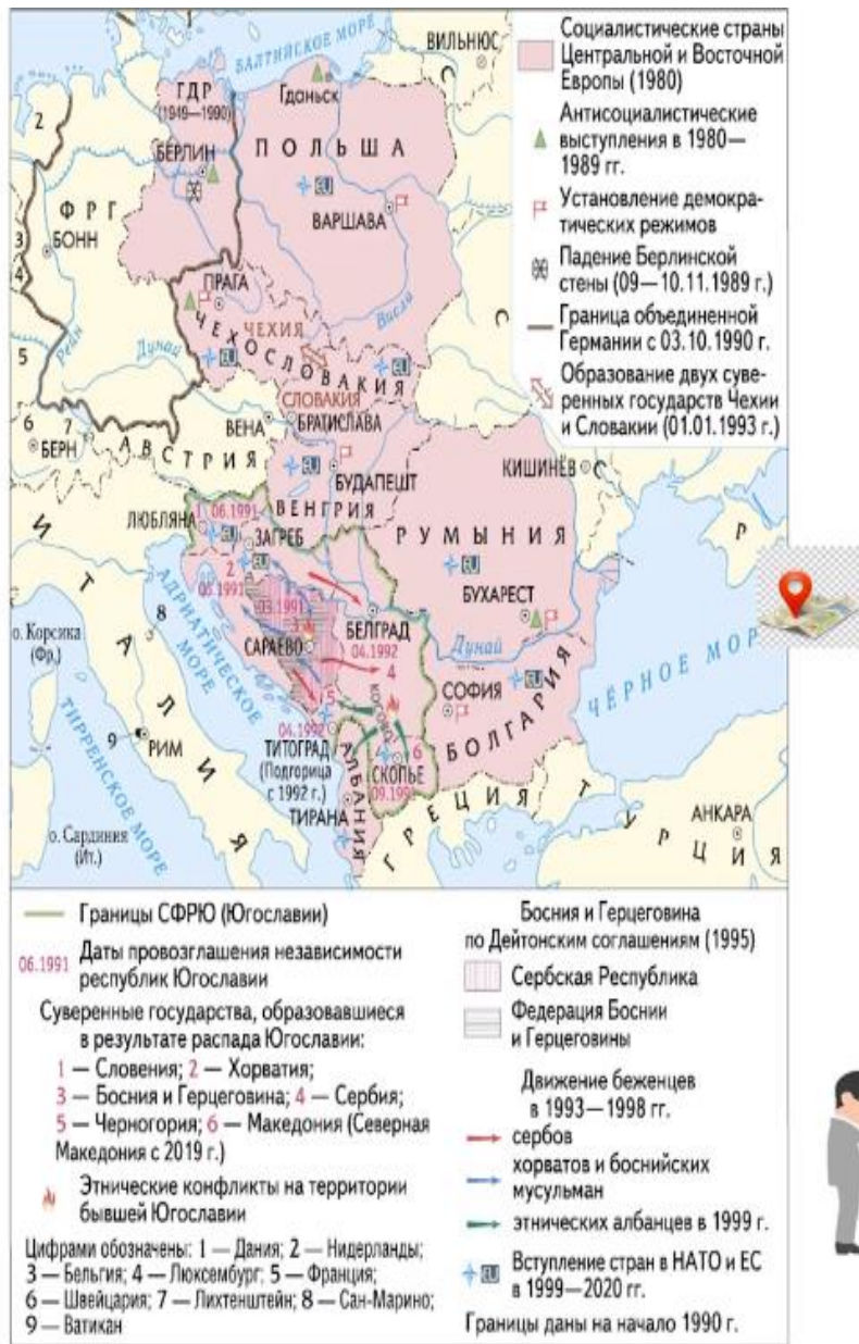
Страны Центральной и Юго-Восточной Европы в 1980—2020 гг.