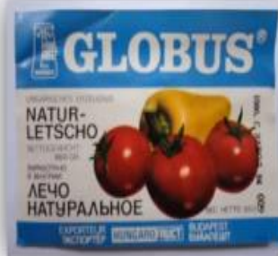
Globus®, лечо натуральное. HUNGAROFRICT, BUDAPEST, Natur-Letscho