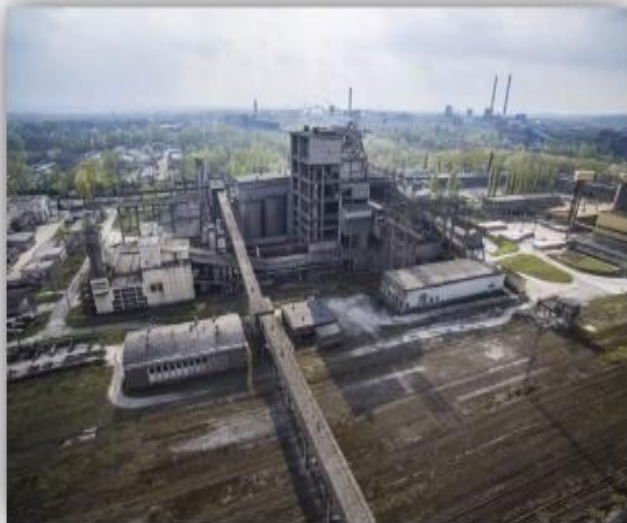
Заброшенные предприятия в Польше (начало 1990-х гг.)