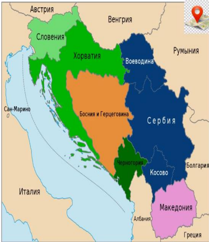
Административно-территориальное деление СФРЮ