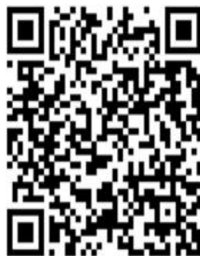
Переход Венгрии к демократии