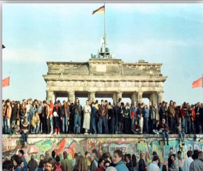
Люди на Берлинской стене, 10 ноября 1989 года