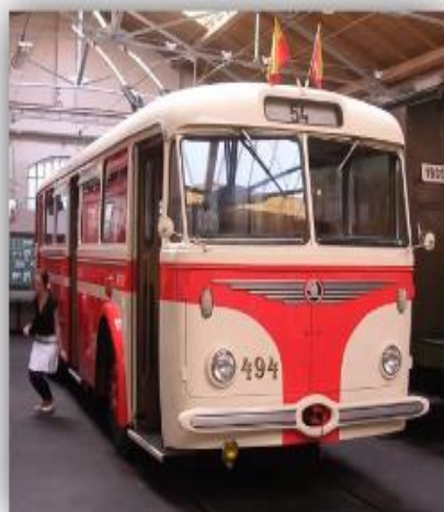
Чешский троллейбус Škoda 8Tr (1956–1961)