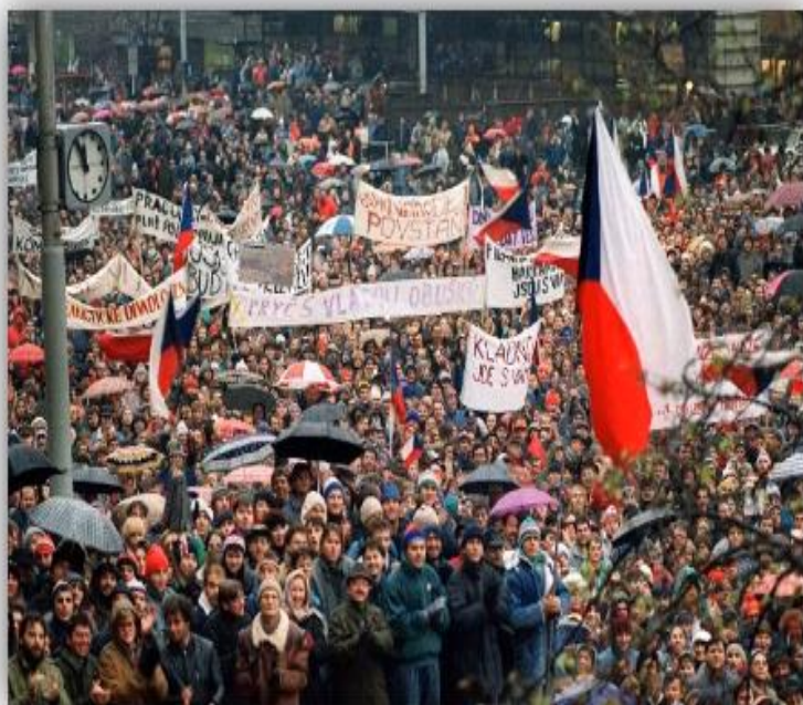
«Бархатная революция» в Чехословакии