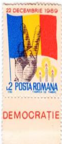
Марка времен Румынской революции 1989г.