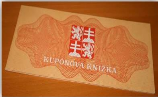
Купонная книжка начала 1990-х гг., Чехия

➤ Проанализируйте предложенный документ. Определите главные черты экономических реформ в Польше. Почему, по мнению Л. Бальцеровича, они имели успех?