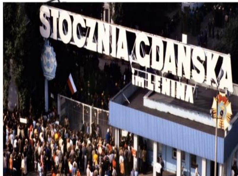
Протесты на Гданьской судовой верфи, август 1980 г.