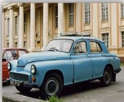
Польский пассажирский автомобиль, являлся лицензионной копией советского ГАЗ-М-20 «Победа», позже был переработан FSO.