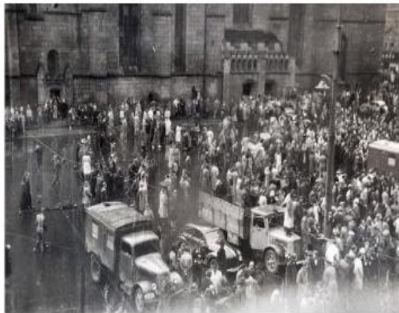
Восстание в Пльзене (Чехословакия)