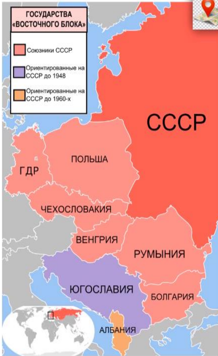
Государства Восточного блока в Европе