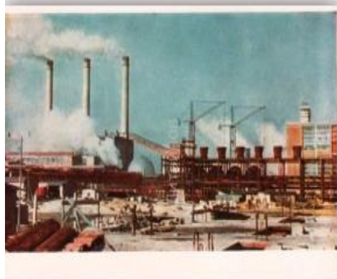
Буругольный комбинат «Шварце Пумпе» ГДР