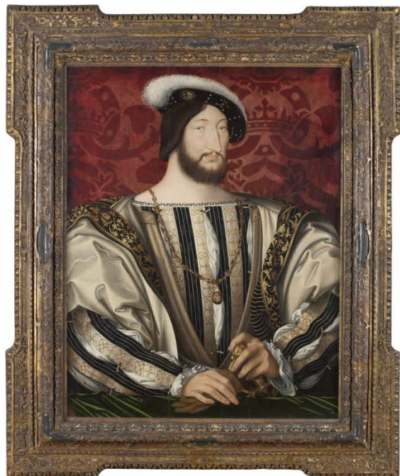
François 1er par Jean Clouet, huile sur panneau de bois vers 1530 (hxl : 96 x 74 cm)

On note que chaque cadrage des portraits à une nomenclature 1 précise comme nous le montre l'illustration de Gérald ANGIBAUD Photographes contemporains à Saumur.