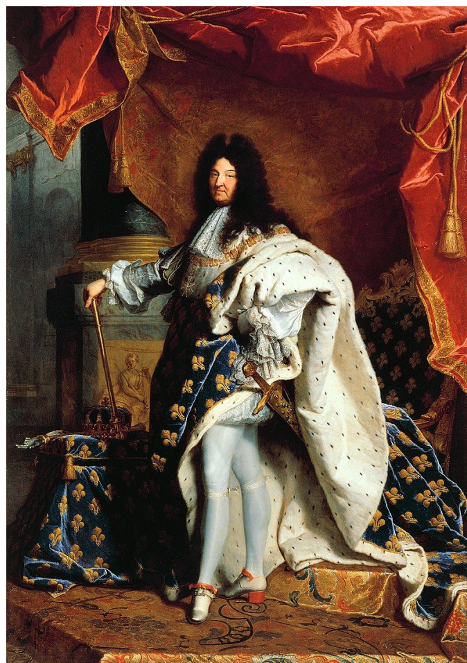
Portrait de Louis XIV par Hyacinthe Rigaud, huile sur toile, en 1701 (hxl : 2,77 x 1,94 m)