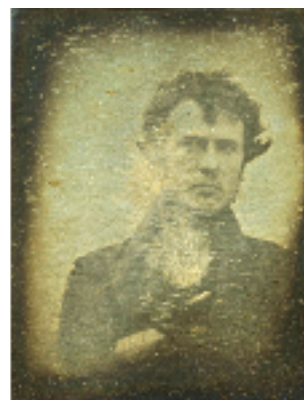
Robert Cornelius (USA), Autoportrait, 1839

Selfie : Le selfie est une pratique très ancienne qui est semblable à celle de l'autoportrait, plus précisément l'autoportrait photographique : on peut ainsi dater de 1839 le premier selfie photographique. (voir invention de la photographie entre 1825 et 1830)