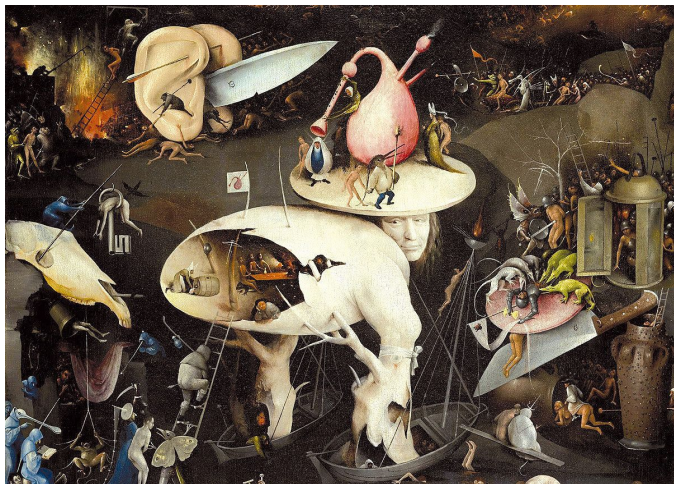
J. Bosch "le jardin des délices" peinture à l'huile sur bois (extrait) - 1503-1504

1/ Un courant artistique doit-il toujours être attaché à un seul domaine artistique ? OUI - NON