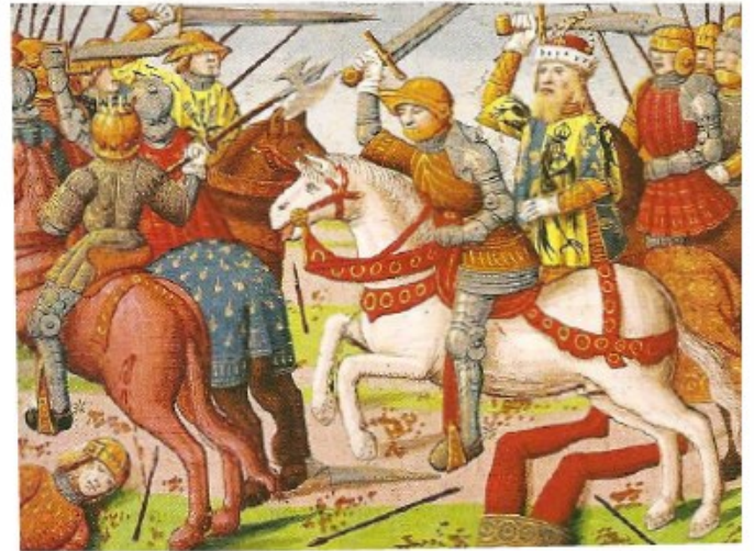
Miniature d'un manuscrit du xv ème siècle