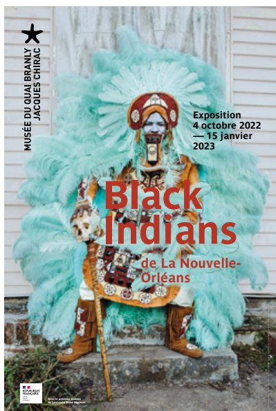
© Photo by Danielle C. Miles © musée du quai Branly – Jacques Chirac, DA © g6 design