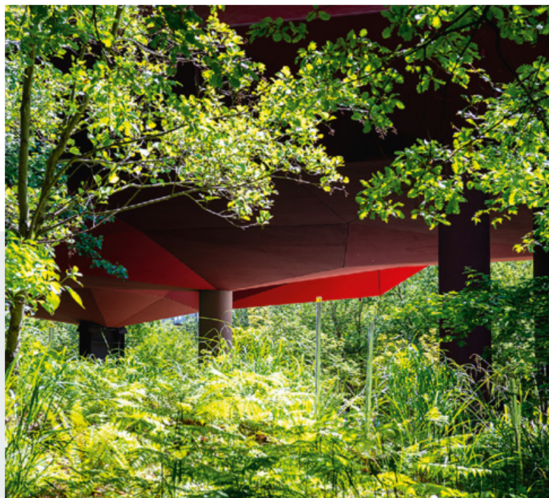
Le jardin du musée conçu par le paysagiste Gilles Clément a été réalisé grâce au mécénat de la Fondation d'entreprise ENGIE.

Enfin tout au long de l'année, les publics scolaires et périscolaires peuvent participer à la riche programmation des rendez-vous scientifiques et culturels du musée (événements, conférences, projections, spectacles, etc.).