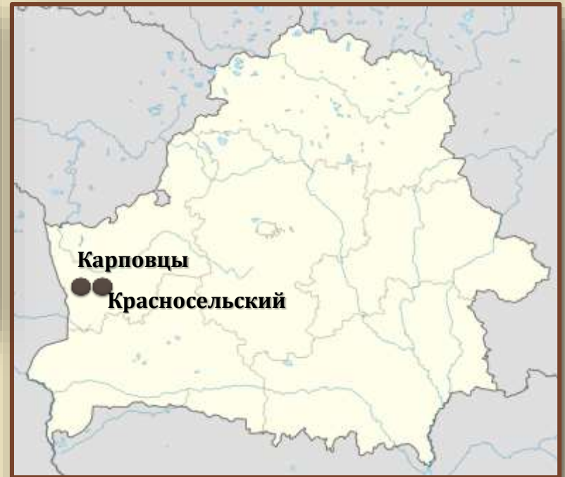
Древние кремнедобывающие шахты