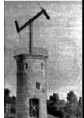
Premier télégraphe optique entre Paris et Lille en 1794

On a ainsi utilisé différents types de signaux comme, en 1794, le télégraphe optique de Claude Chappe. Des tours à signaux étaient placées à visible distance l'une de l'autre. De grands leviers s'élevaient et s'abaissaient de ces tours épelant par différentes positions les messages de poste en poste jusqu'à destination. Ces différents mécanismes de transmission avaient leurs inconvénients : les signaux sonores et visuels ne pouvaient pas être utilisés sur de longues distances ni dans n'importe quelles conditions. Le document écrit par exemple, transmis par des messagers, mettait souvent beaucoup trop de temps pour arriver à destination.