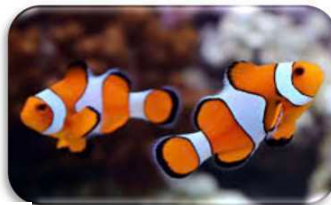
Un poisson clown

Il existe une multitude de poissons. il y en a de toutes les tailles et de toutes les couleurs.