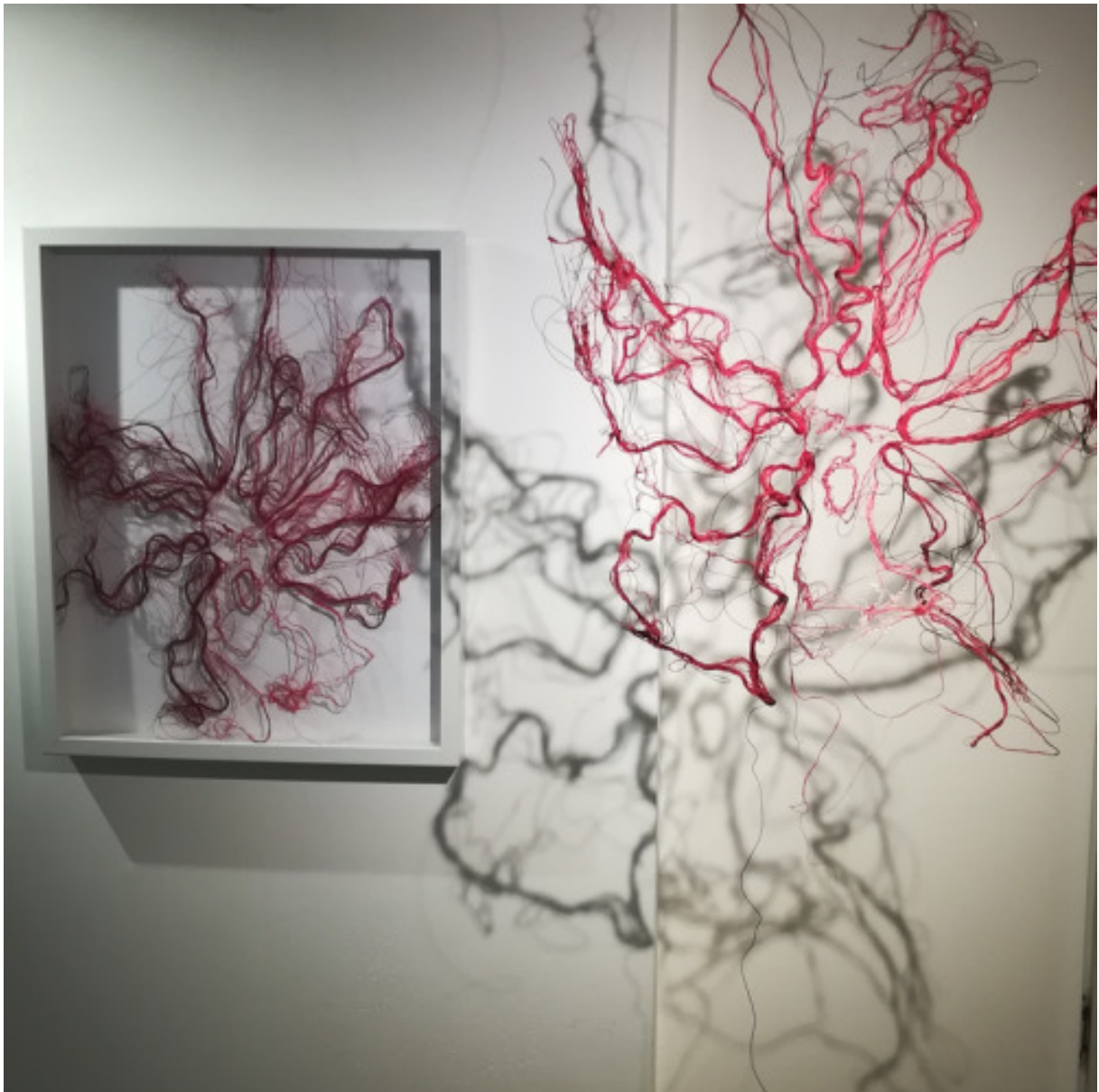
Méduse médusée , suspension et encadrée, fils de couture, galerie58, Paris, 2019.

Figure, vulve, nature, couture, suspension, ombre, aquarelle