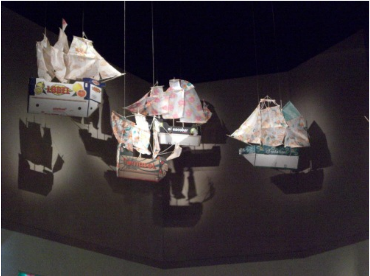
Fanny de Pagnol, Vieux Colombier, Comédie Française 2008, matériaux de récupération, rideaux de douche + cageots de fruits.

Inscrire dans l'espace Raconter des histoires