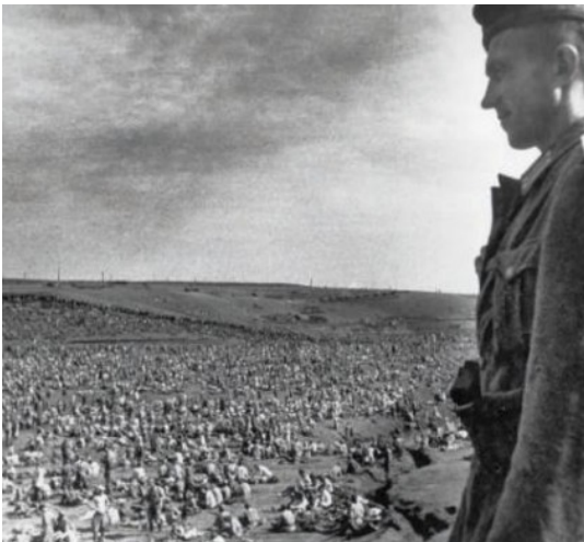
Un camp à ciel ouvert de prisonniers de guerre soviétiques, en Ukraine, à l'été 1941

3,5 millions de prisonniers de guerre soviétiques perdent la vie, exécutés ou victimes des conditions dramatiques de leur détention, après avoir été capturés par l'armée allemande.