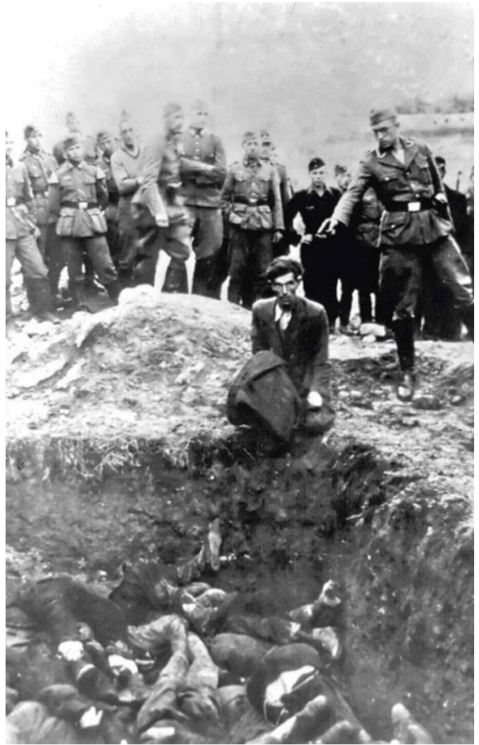
Un membre d'un Einsatzgruppen sur le point d'exécuter un juif agenouillé devant une fosse commune partiellement remplie de cadavres, à Vinnitsa (Ukraine), 1942, photographie anonyme