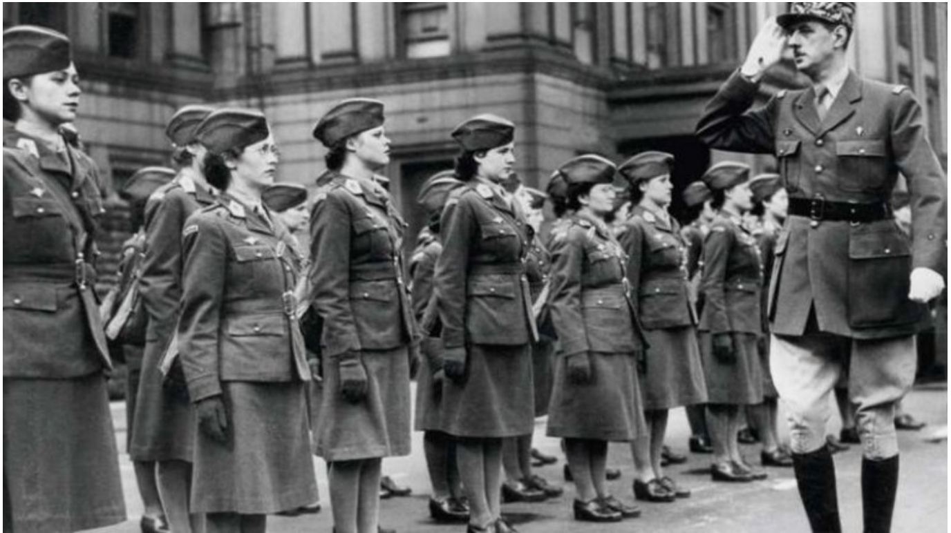
Charles de Gaulle passant en revue les volontaires féminines de la France libre à Londres, 1942, photographie anonyme.