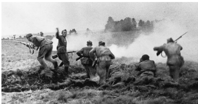
Soldats russes prenant du terrain lors de l'opération Bagration. Photographie anonyme.