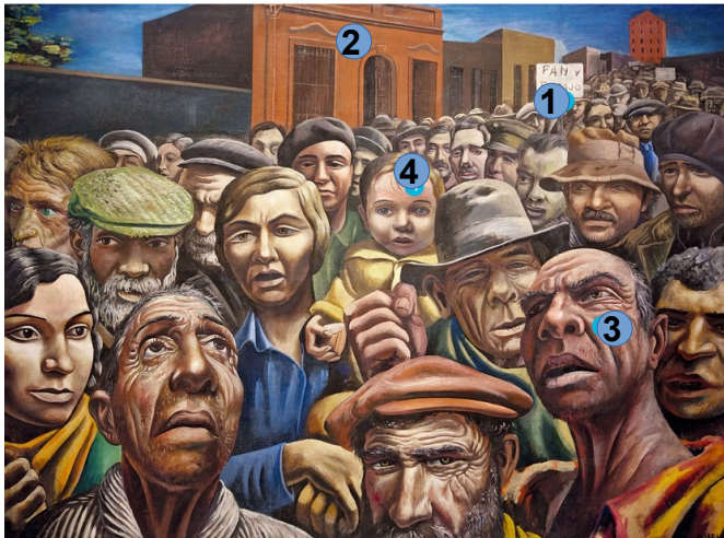
Antonio Berni, Manifestación , 1934, détrempe sur toile, 128 × 247,5 cm, Museo de Arte Latinoamericano, Buenos Aires.

1 - On lit sur cette pancarte le même slogan que sur l'image des mineurs du Nord : « Du pain et du travail ». Ainsi, non seulement la crise et le chômage touchent tous les pays, les revendications des manifestants semblent partout les mêmes : de quoi gagner de l'argent et de quoi se nourrir.