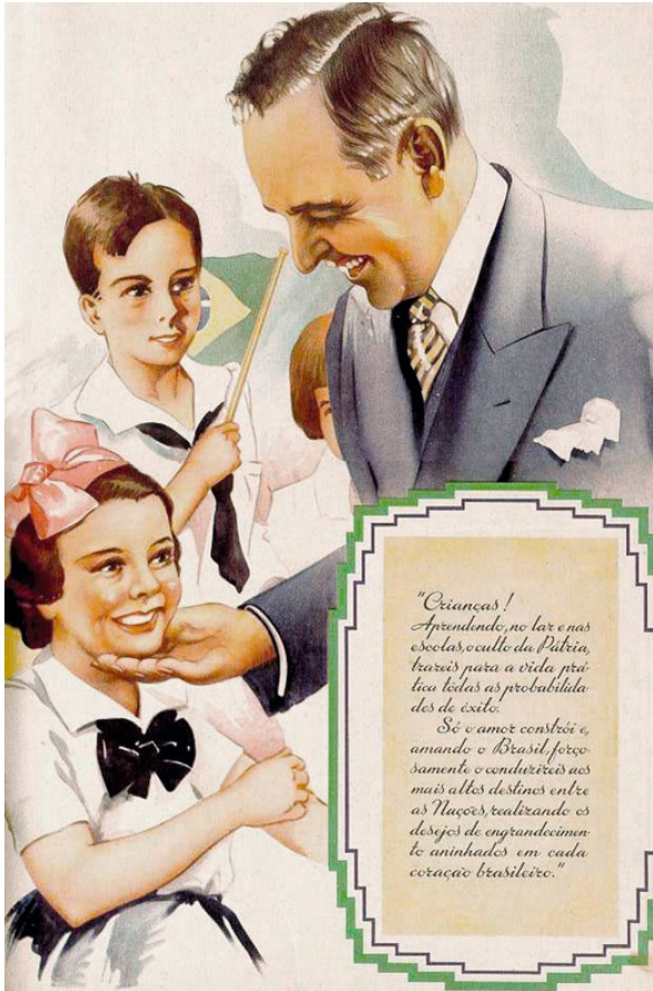
Anonyme, Affiche de propagande de l'Estado Novo, v. 1938.

« Les enfants ! En apprenant, à la maison et à l'école, le culte de la Patrie, vous donnerez toutes les chances de réussir votre vie. »