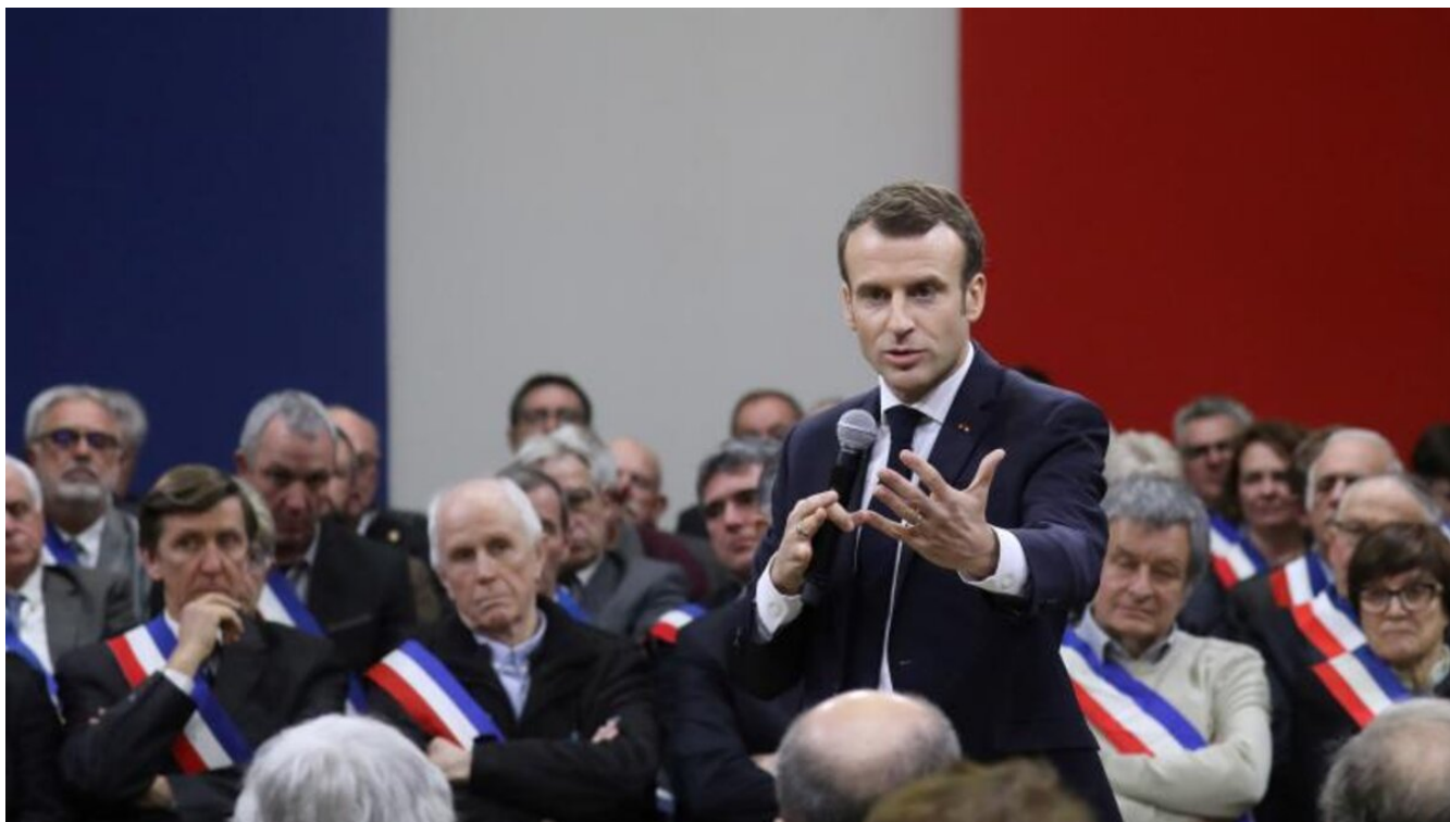
Emmanuel Macron à Souillac (Lot), devant 600 maires, le 18 janvier 2019.

Selon une vieille acception, incendiaire qualifie aussi, dit le Larousse, ce « qui est propre ou vise à échauffer les esprits, à inciter à la révolte ou à la sédition ». Depuis que les gilets jaunes se sont imposés dans le débat public, le pouvoir n'a cessé de vouloir les discréditer et les délégitimer. De « la foule haineuse » à « Jojo le gilet jaune », ils ont été renvoyés au statut de plèbe ignare et dangereuse, obscure et menaçante, réduits à la violence, aux incidents et aux dérapages, dans l'ignorance entêtée de la dynamique politique originale et inédite de ce mouvement auto-organisé.