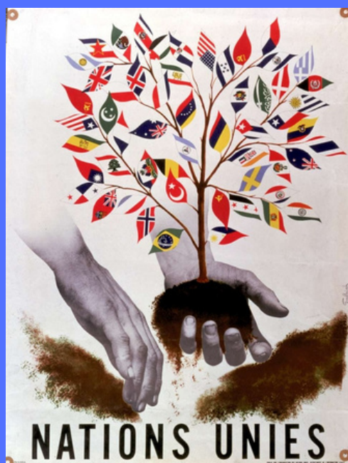
Affiche qui symbolise une coalitions

LA CHINE, PREMIÈRE VICTIME DES PUISSANCES DE L'AXE PENDANT LA SECONDE GUERRE MONDIALE, FUT SYMBOLIQUEMENT LA PREMIÈRE À LA SIGNER. ELLE FUT ENSUITE SIGNÉE PAR L'AFRIQUE DU SUD, L'ARGENTINE, L'AUSTRALIE, LA BELGIQUE, LA BIÉLORUSSIE... LA POLOGNE EST ÉGALEMENT CONSIDÉRÉE COMME UN SIGNATAIRE, MALGRÉ SON ABSENCE À LA CONFÉRENCE. AU MOMENT DE LA SIGNATURE, IL N'Y AVAIT PAS DE GOUVERNEMENT POLONAIS RECONNU. LA CHARTE EST DÉSORMAIS SIGNÉE PAR 193 PAYS.