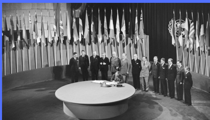
Conseil afin de réunir les pays (1945)