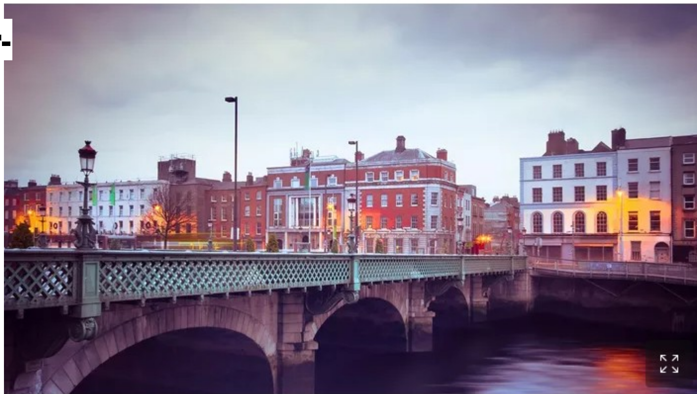
L'Irlande et sa capitale Dublin sont devenues depuis plusieurs années la destination de prédilection des multinationales américaines.

Concurrence fiscale Entre organisations inter- gouvernementales (OIG) pour les FTN Ex : Irlande