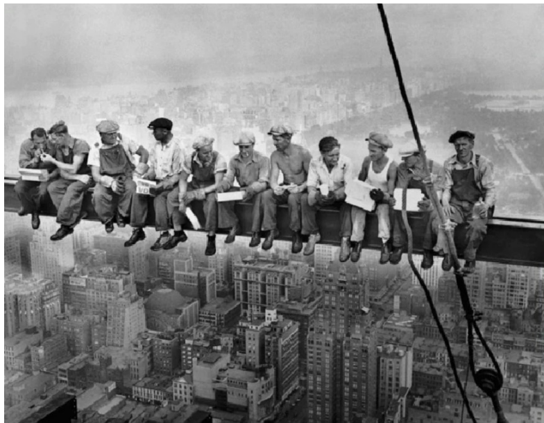
Anonyme, Men at lunch , New-York, septembre 1932