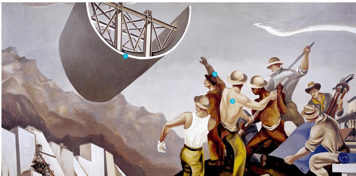
William Gropper, Construction d'un barrage , 1939, fresque murale (détail), 8,5 × 2,5 m, Département de l'Intérieur, Washington, D.C.

(1) Une politique de grands travaux : Pour peindre cette fresque, l'artiste s'est inspiré à la fois du barrage de Grand Coulee sur la Columbia river et du barrage David sur la Colorado river. Pendant le New Deal, ces deux barrages ont été construits afin de fournir de l'électricité et de faciliter l'irrigation dans ces régions fortement touchées par la crise.