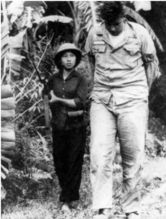
Anonyme, « La Bataille du riz », 1965

Doc. 3 : Photographie d'enfants fuyant un bombardement américain