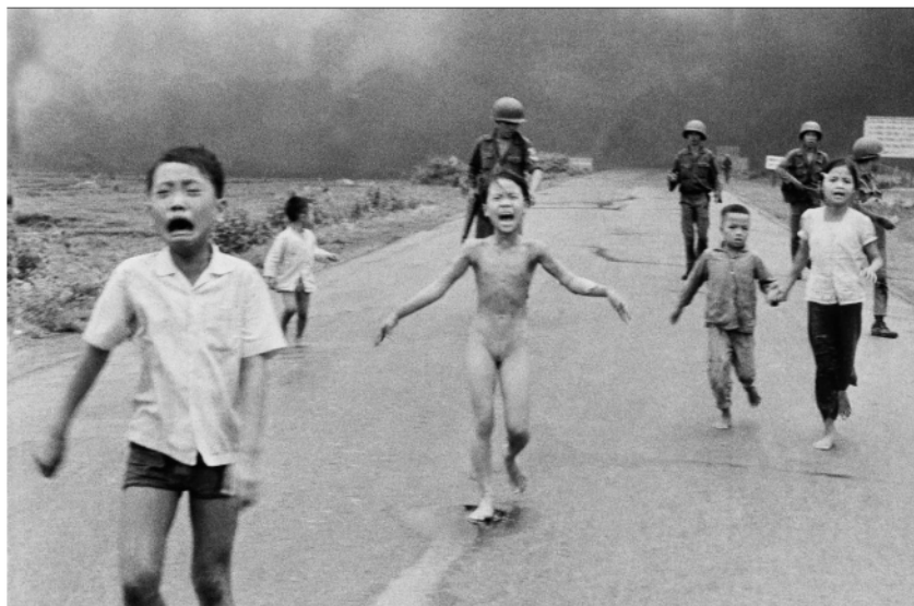
Nick Ut, La petite fille au napalm , 1967

Doc. 4 : Photographie du même événement que le doc. 3 avec une autre perspective