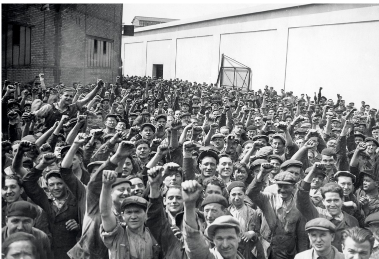
Ouvriers de l'usine automobile Renault à Boulogne-Billancourt en grève, 28 mai 1936, photographie anonyme.