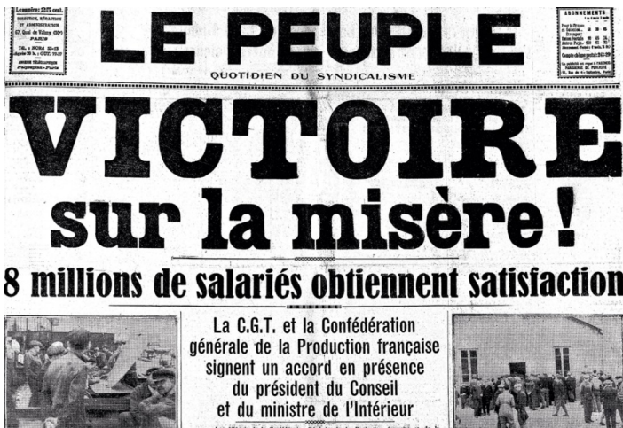
Couverture du journal syndical de la CGT : Le Peuple .