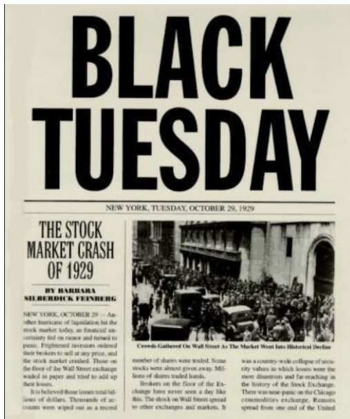
Ci-dessus, la une d'un journal new-yorkais.

Doc.3 : La crise et ses conséquences aux États-Unis