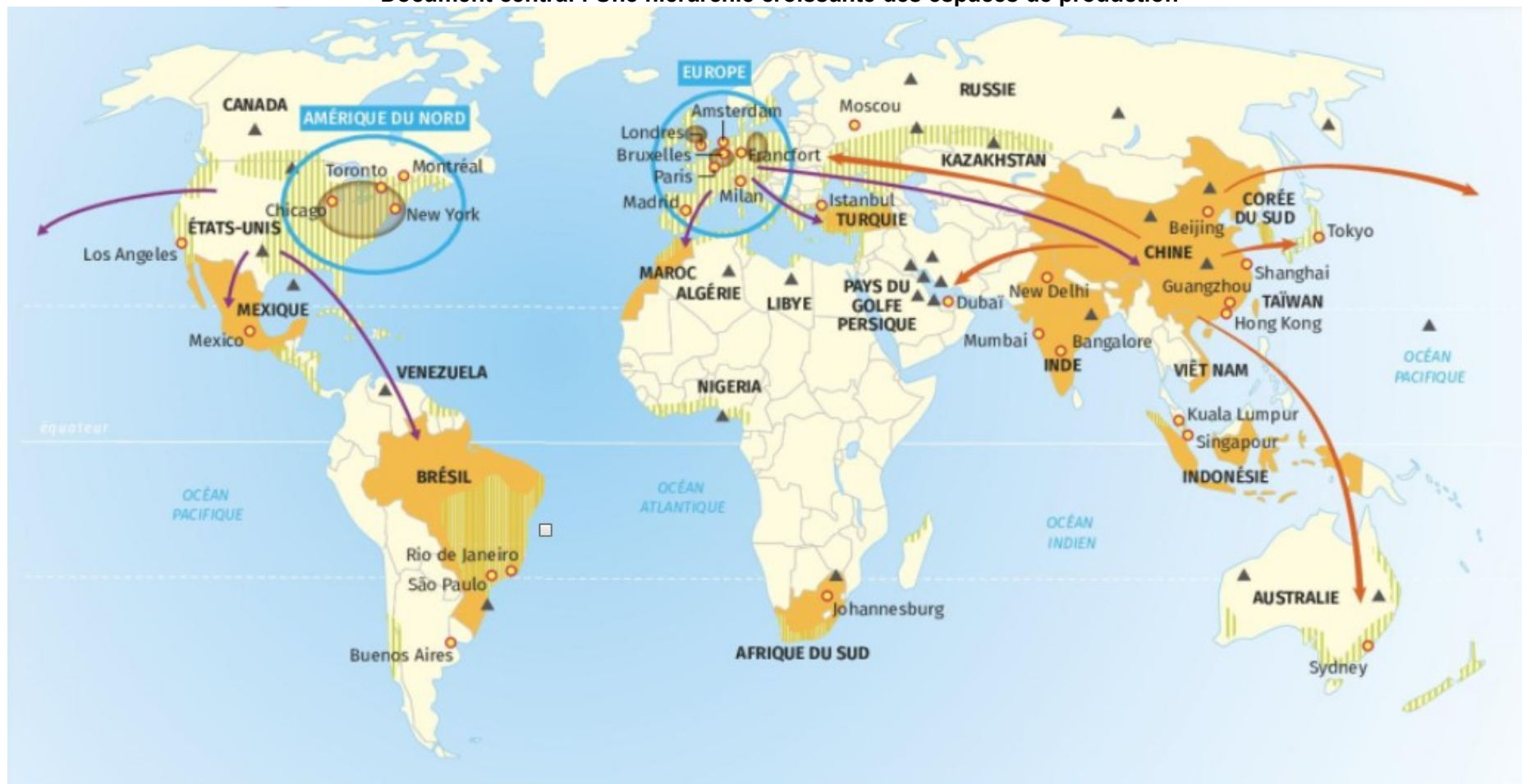
Document central : Une hiérarchie croissante des espaces de production