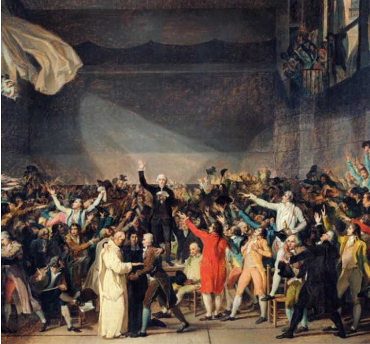
Jacques-Louis David, Le Serment du jeu de paume , 1791, huile sur toile, 66 x 101,2 cm, musée national du Château de Versailles, Versailles

Après que les députés du tiers-état se soient réunis le 17 juin 1789 et revendique représenter la souveraineté nationale . Ils se donnent pour objectif de rédiger une Constitution . Le 20 juin 1789 , ils se réunissent et prêtent serment de ne jamais se séparer avant que la France ait une Constitution . Le roi Louis XVI est contre. Il pense être le seul souverain du pays.