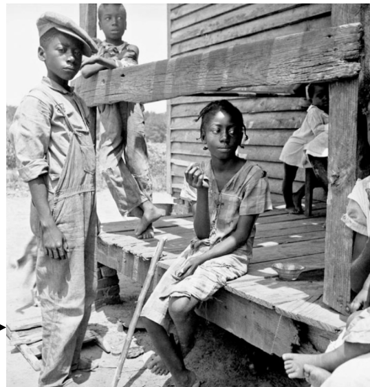
Dorothea Lange, enfants dans le delta du Mississippi, 1936, photographie argentique, 23,8x25,4cm, Library of Congress, Washington