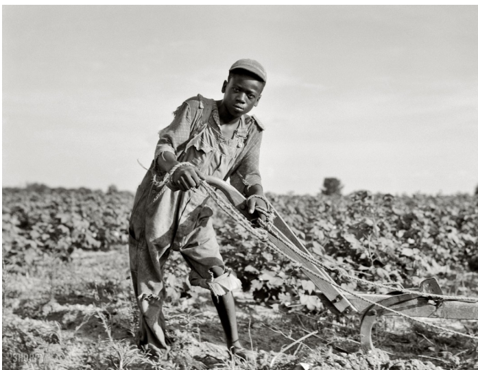
Doc. 6 : Un enfant travaillant dans les champs dans l'État du Mississippi