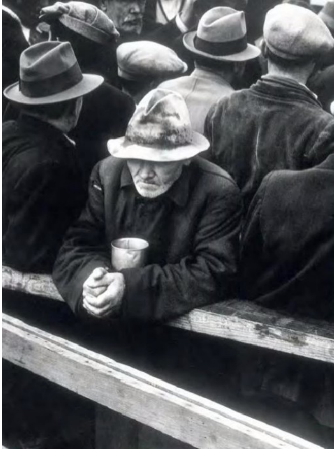
Dorothea Lange, La soupe populaire White Angel , photographie argentique, 1933, 35,3x27,9cm, Musée des beaux-arts du Canada, Ottawa.