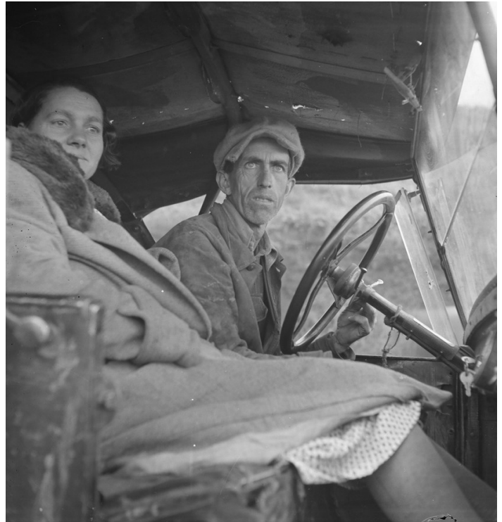
Doc. 5 : Un couple, sur la route à l'ouest des États-Unis