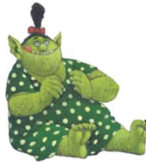
MAMAN OGRE Maman Ogre