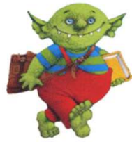
PETIT OGRE Petit Ogre