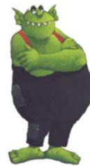
PAPA OGRE Papa Ogre