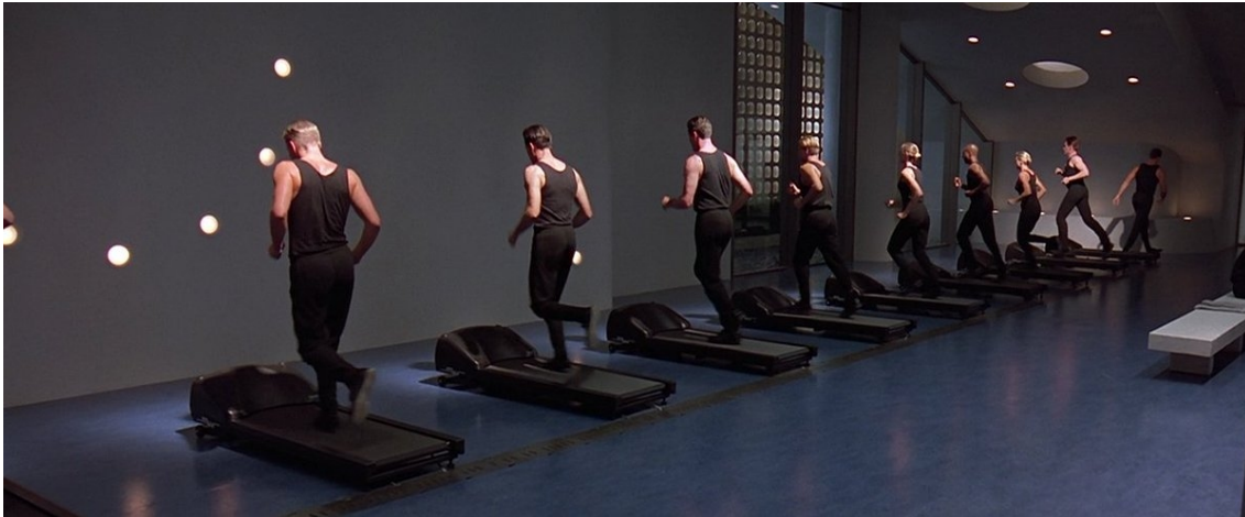
Bienvenue à Gattaca , film d'anticipation réalisé par Andrew Niccol en 1997