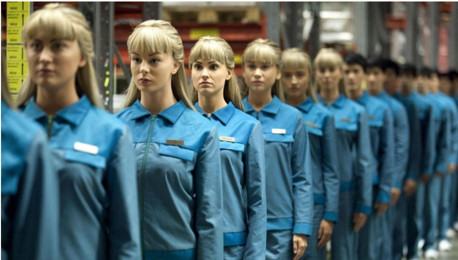
Äkta Människor, série suédoise diffusée en France sur Arte en 2012

Äkta Människor (Real Humans) est une série qui se situe dans un monde parallèle où les robots humanoïdes (Hubot) sont devenus des machines courantes dans la société. Ces Hubots sont très réalistes et sont configurés de telle sorte à remplir une large demande. S'adaptant à tous les besoins humains, de la simple tâche ménagère à des activités plus dangereuses voire illégales, la société semble en dépendre. Une partie de la population refuse alors l'intégration de ces robots tandis que les machines manifestent des signes d'indépendance et de personnalité propre