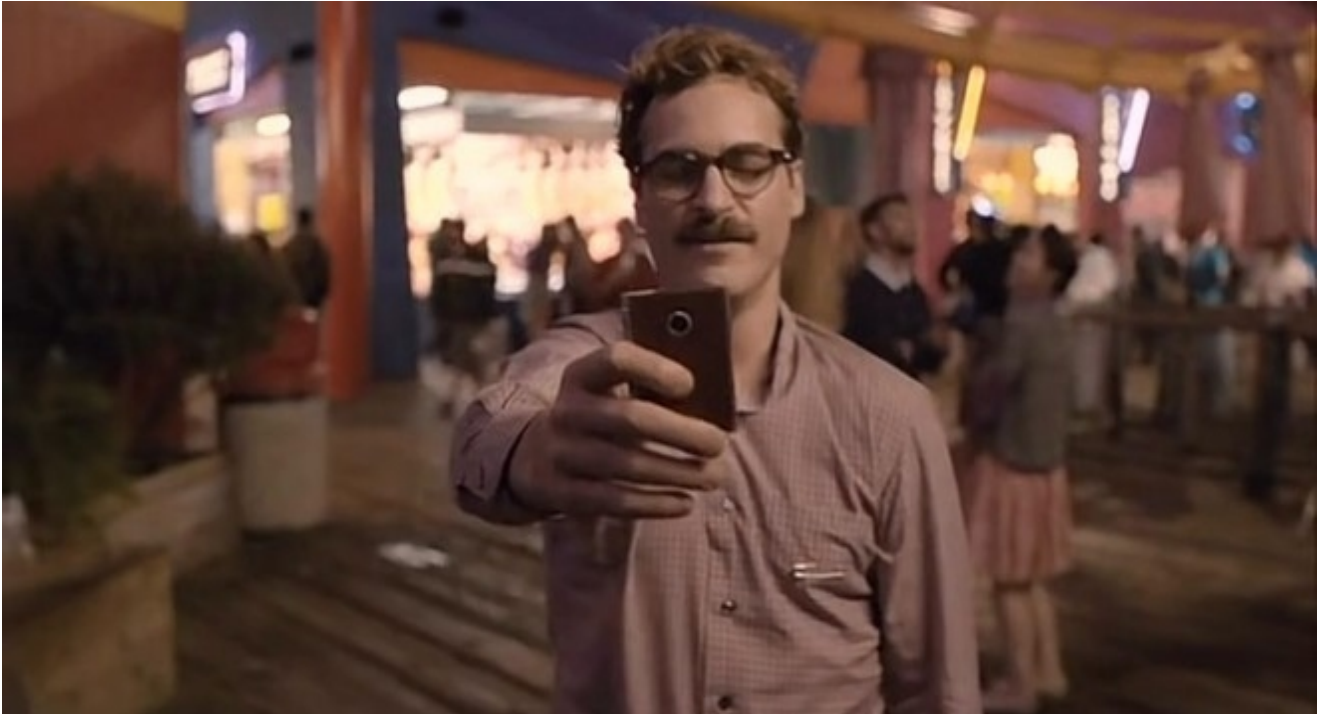
Her, comédie dramatique de science-fiction réalisée par Spike Jonze en 2014

Dans un futur proche, à Los Angeles, Theodore travaille comme écrivain public pour une entreprise, rédigeant des lettres de toutes sortes – familiales, amoureuses... – pour d'autres. Son épouse Catherine et lui ont rompu depuis bientôt un an mais il ne se décide pas à signer les papiers du divorce. Dans un état de dépression qui perdure, il installe sur son ordinateur personnel un nouveau système d'exploitation OS1, auquel il donne une voix féminine. Cette dernière, une intelligence artificielle conçue pour s'adapter et évoluer, se choisit le prénom Samantha. Ils entament alors une relation amoureuse et passionnée, bien qu'atypique.