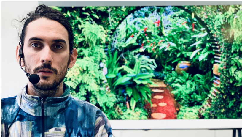
Affiche de Soon

Le « selfie » est un phénomène apparu récemment dans la culture adolescente qui a pris une ampleur impressionnante. Le mot vient du terme anglais self , « soi », et a fait son apparition dans la nouvelle version du dictionnaire Oxford en 2013, où il a été élu « mot de l'année ». Se « selfiser » consiste ainsi à se photographier soi-même à l'aide du portable, puis à diffuser la photo sur les réseaux sociaux ( Facebook ou autres).