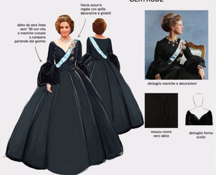
COSTUMES OFELIA ET GERTRUDE - MAQUETTES D'AURELIO COLOMBO