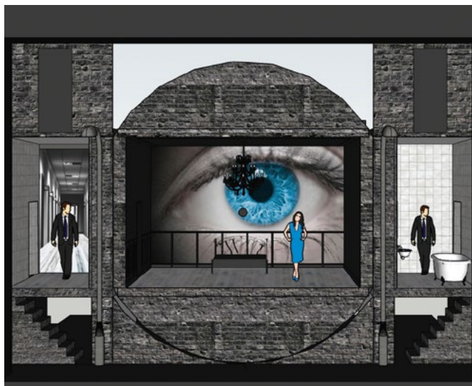
MAQUETTES DES DÉCORS DE LA VOIX HUMAINE – POINT D'ORGUE RÉALISÉES PAR PIERRE-ANDRÉ WEITZ