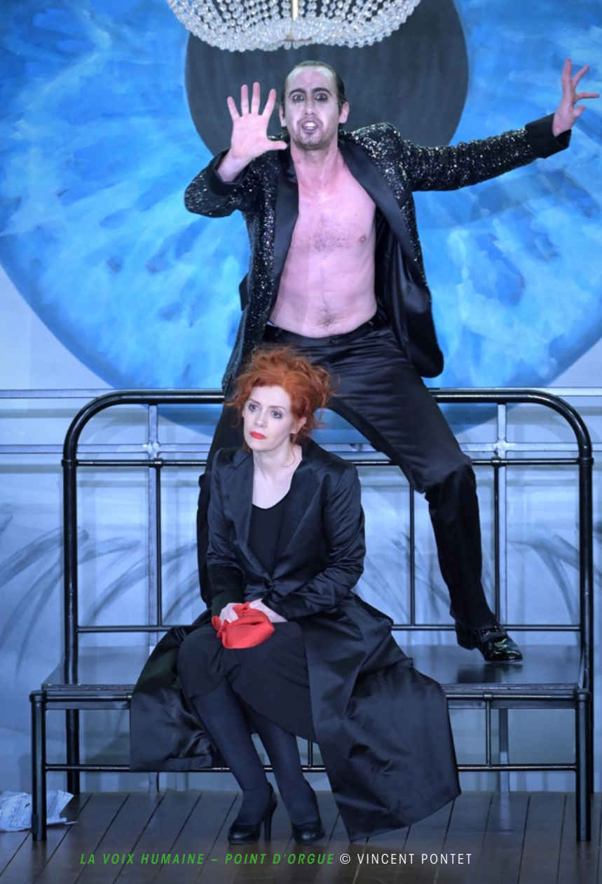
LA VOIX HUMAINE – POINT D'ORGUE