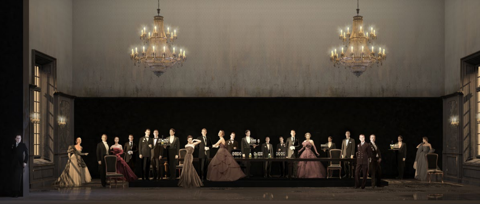
DÉCOR HAMLET ACTE I AURELIO COLOMBO