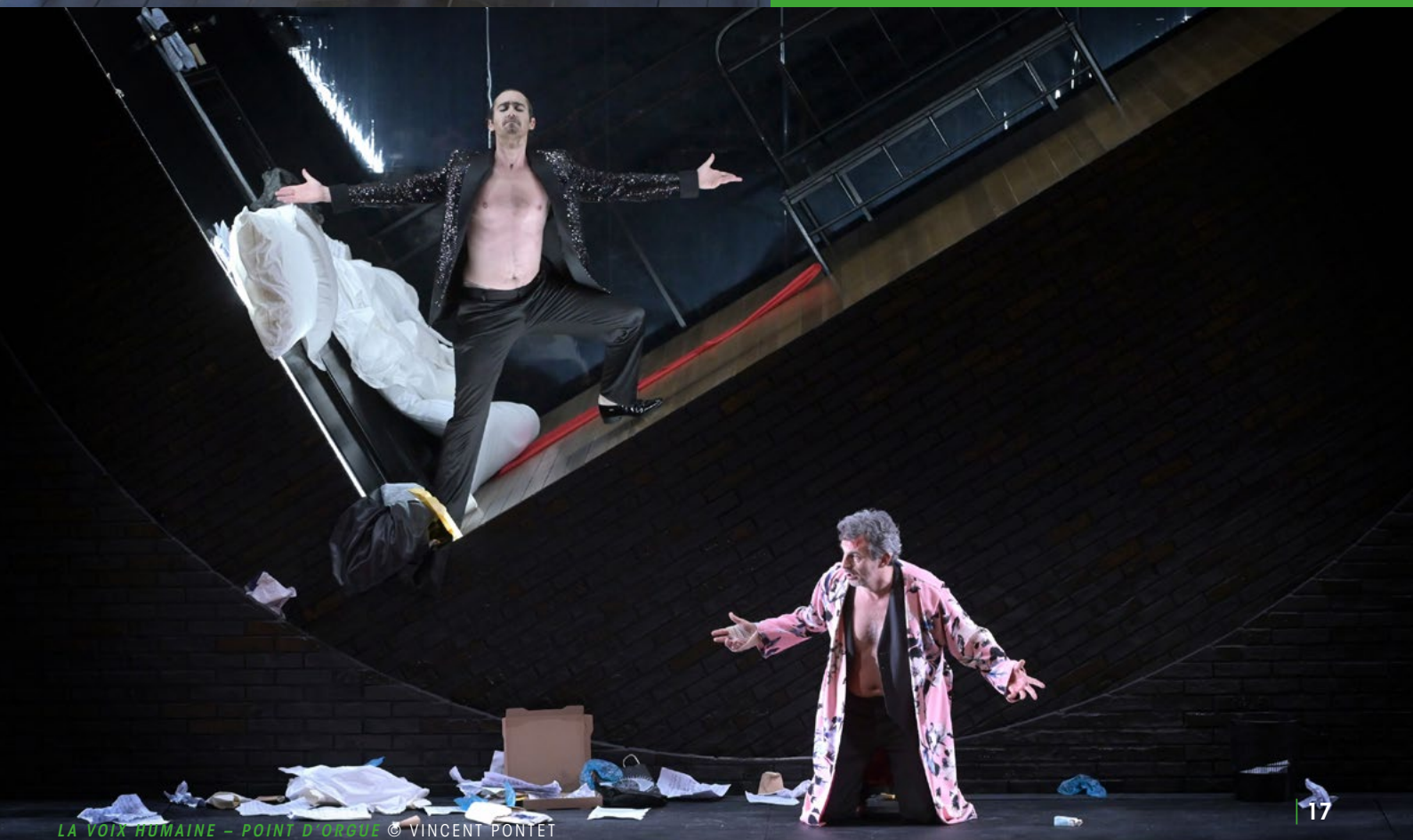
LA VOIX HUMAINE – POINT D'ORGUE