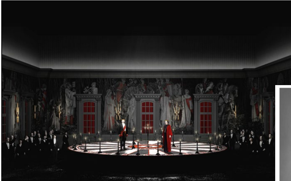
MAQUETTE DES DÉCORS DE LANCELOT RÉALISÉS PAR BRUNO DE LAVENÈRE