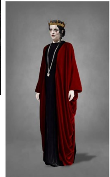
MAQUETTE DU COSTUME DE GUI- NIÈVRE DANS LANCELOT RÉALISÉE PAR JEAN-ROMAIN VESPERINI ET BRUNO DE LAVENÈRE