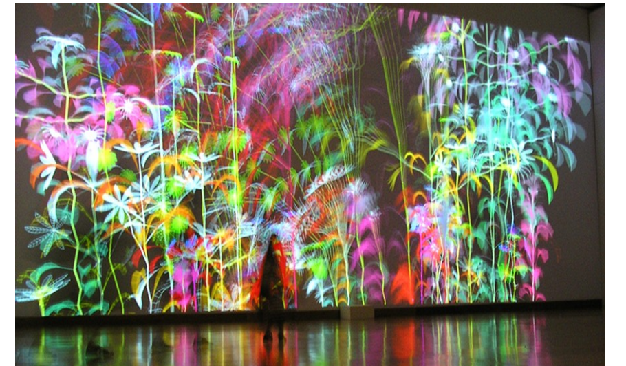
Miguel Chevalier (1959-), Sur-natures, sous-titre : Paradis artificiel , 2004,

Huile sur toile, H. : 133 cm, L. : 260 cm, Achat après commande de l'État en 1849, Paris, musée d'Orsay