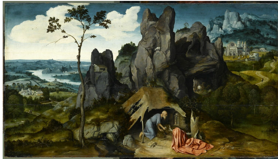
Joachim Patinir (vers 1480-1584), Saint Jérôme dans le désert , vers 1515-1520

Huile sur panneau de bois, H. : 78 cm, L. : 137 cm, Paris, musée du Louvre