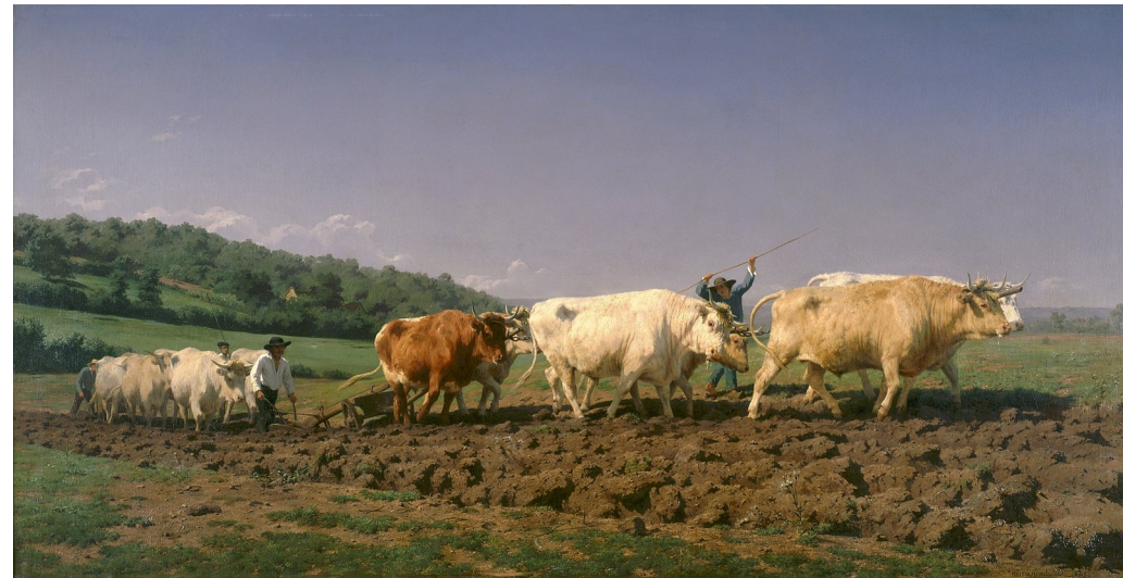
Rosa Bonheur (1822-1899), Labourage nivernais , 1849,

Huile sur panneau de bois, H. : 78 cm, L. : 137 cm, Paris, musée du Louvre