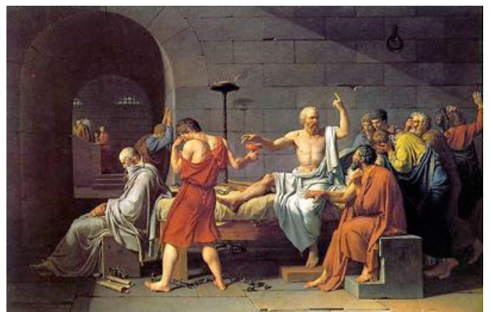
J.L. DAVID, la mort de Socrate , 1787, huile sur toile.