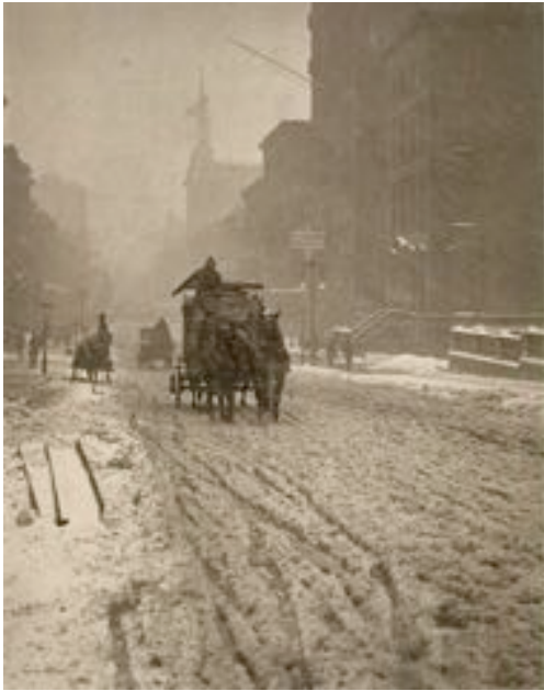
A.STIEGLITZ.Winter, 5th Av.1893

A la fin du XIXème siècle, alors que la pratique de la photographie devient populaire, un groupe de photographes tente, avec des moyens « manuels », graphiques et picturaux (interventions sur les négatifs, sur les épreuves, retouches, techniques proches de l'estampe..), mais aussi avec les « filtres » naturels ( brume, brouillard, écrans divers, pluie) et les moyens photographiques (flou, grain du papier..), de l'élever au niveau de la peinture. Ils revendiquent le même prestige : la photo étant pour eux un des beaux arts. On appelle ce mouvement le PICTORIALISME (de l'anglais picture : image).