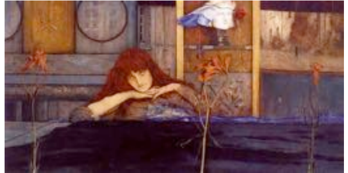
Fernand Khnopff, I Lock My Door Upon Myself , 1891