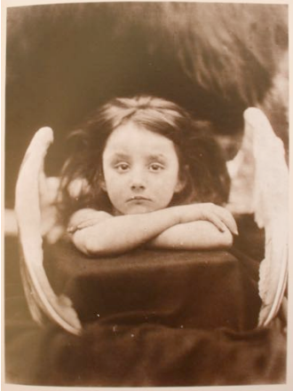
J.M.CAMERON, I wait , 1872