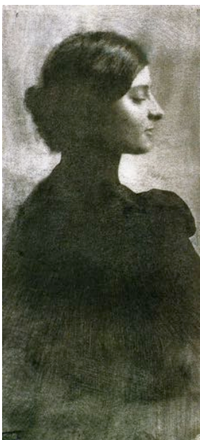
A.STIEGLITZ, portrait de femme , 1890