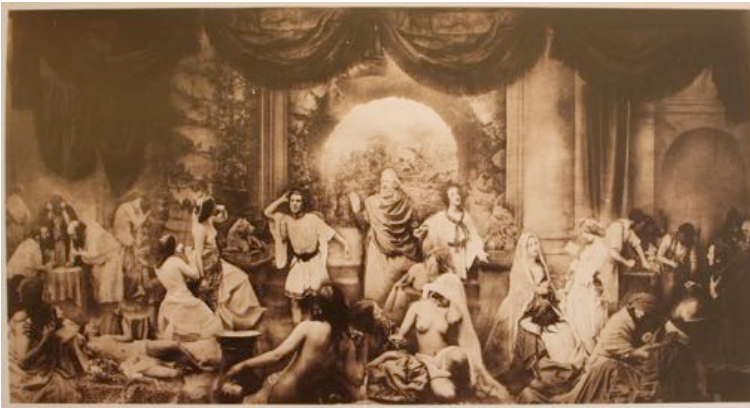
O. G. REJLANDER Allégorie de la vie moderne montage photographique, 1857.