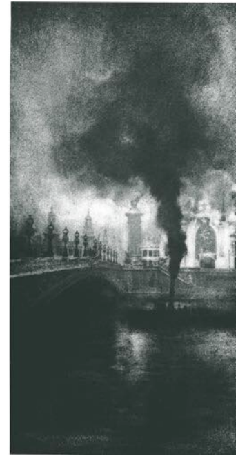
R.DEMACHY, grand palais , 1900