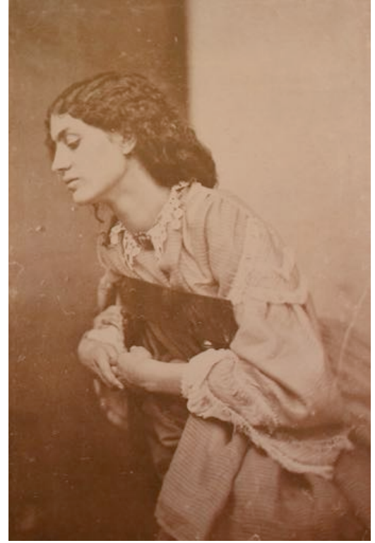
Anonyme, Jane Morris posant pour Rossetti, 1865, tirage sur papier albuminé