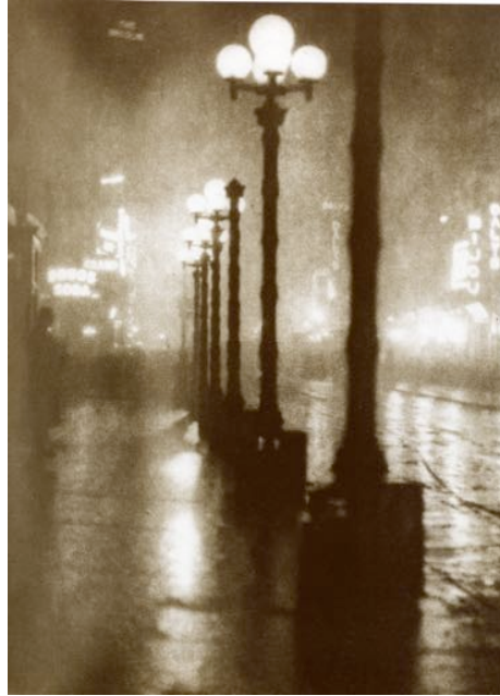
A.COBBURN, vers 1900