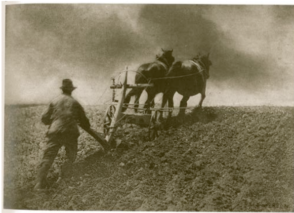
P.H.EMERSON, un rude effort , 1888