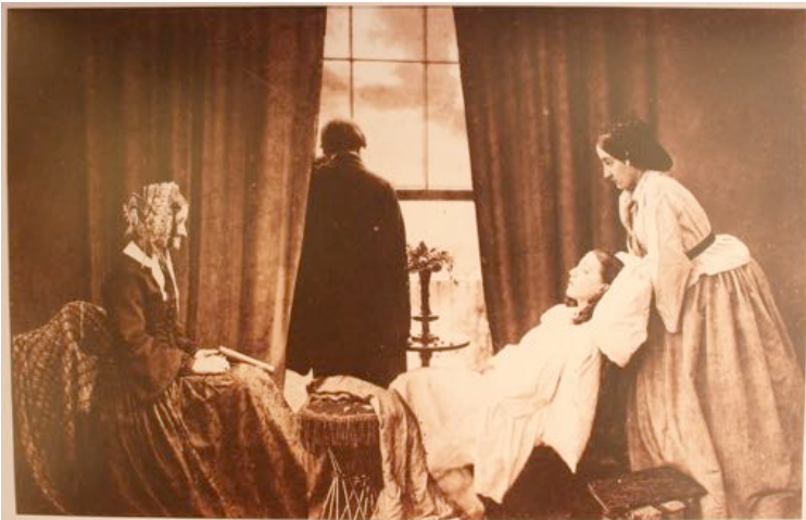
H. PEACH. ROBINSON, le dernier soupir , 1858