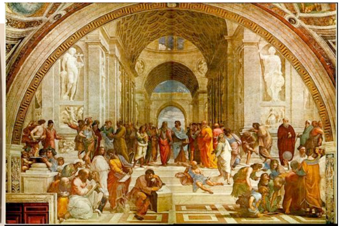
RAPHAEL, L'école d'Athènes , 1510