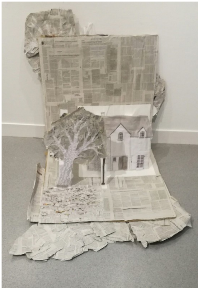
Pop-up géant, en trois pages mobiles, en papier et journal avec écritures.