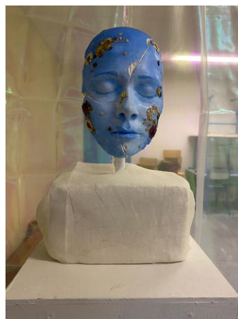
Moulage d'un visage et réalisation du positif. Plâtre, peinture acrylique, fleurs séchés.