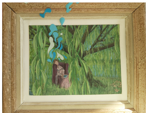
Peinture acrylique, collages papier