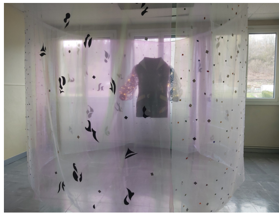
Vue extérieur de l'installation

Modifications apportées sur la veste : (veste noire au départ)