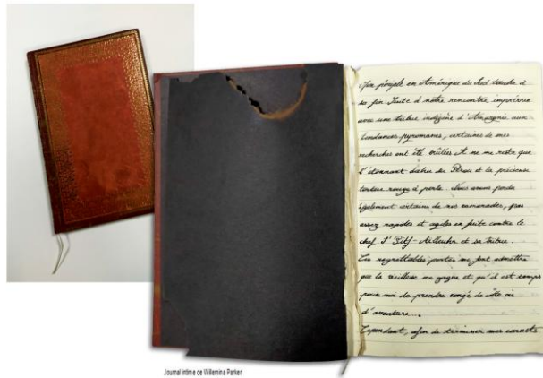
Journal intime de Willemina Parker Fin XIX e siècle, découvert au Harar (Soudan) Écrit à l'encre noire et à la plume 1420x15 cm