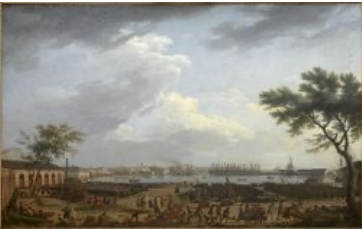
Port Neuf ou L'arsenal de Toulon , 1755, musée de La Marine, Paris.

Repères historiques : La Ville et la rade de Toulon , datée de 1756, a été réalisée avec deux autres vues du port de Toulon. Il fait partie de la série des Ports de France, commandés par le marquis de Marigny, pour Louis XV en 1753 que Vernet a peints entre 1754 à 1765.