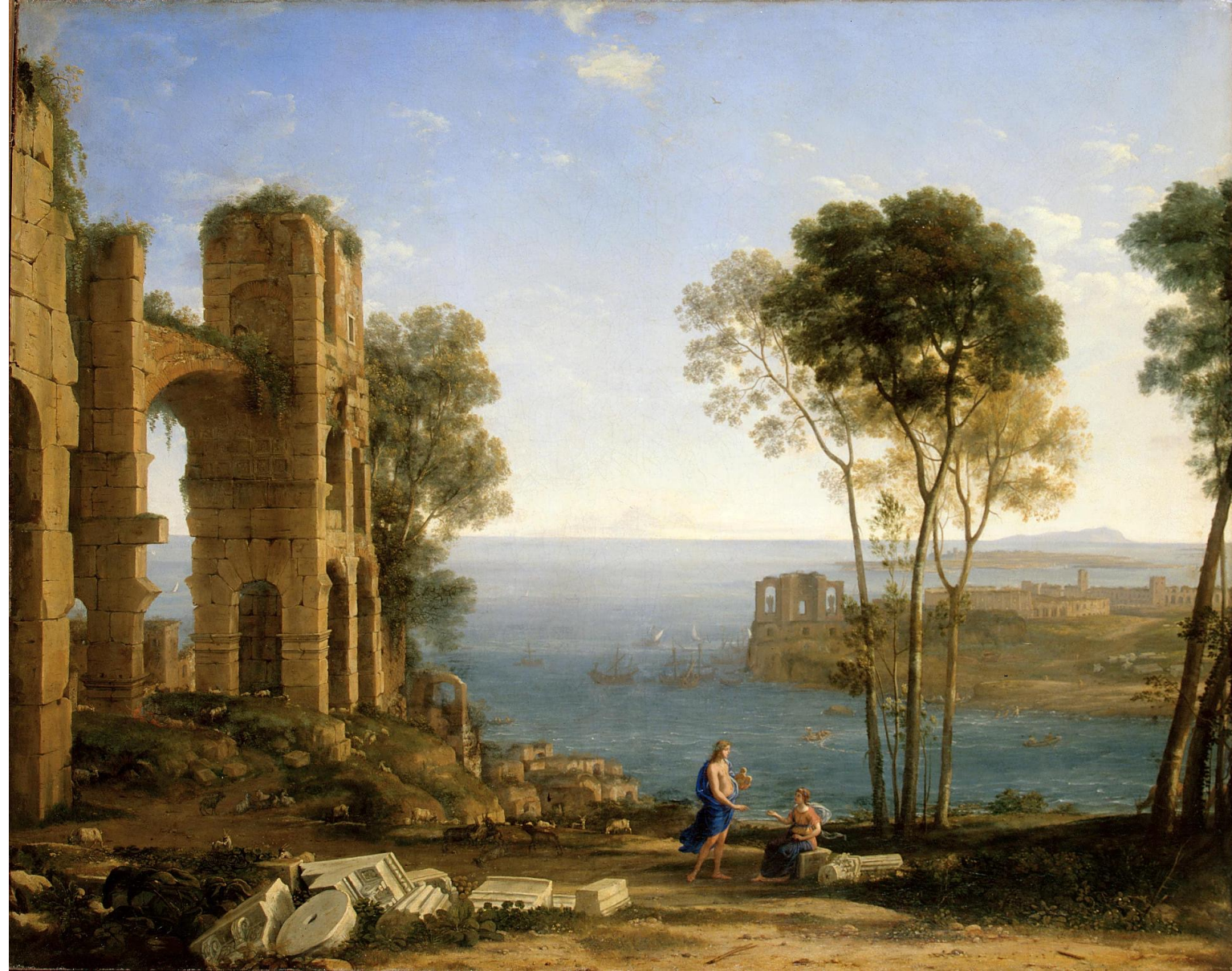
Apollon et la Sybille de Cunnes , 1645-1649, huile sur toile, 99,5 x 127 cm, musée de l'Ermitage, St Petersburg.