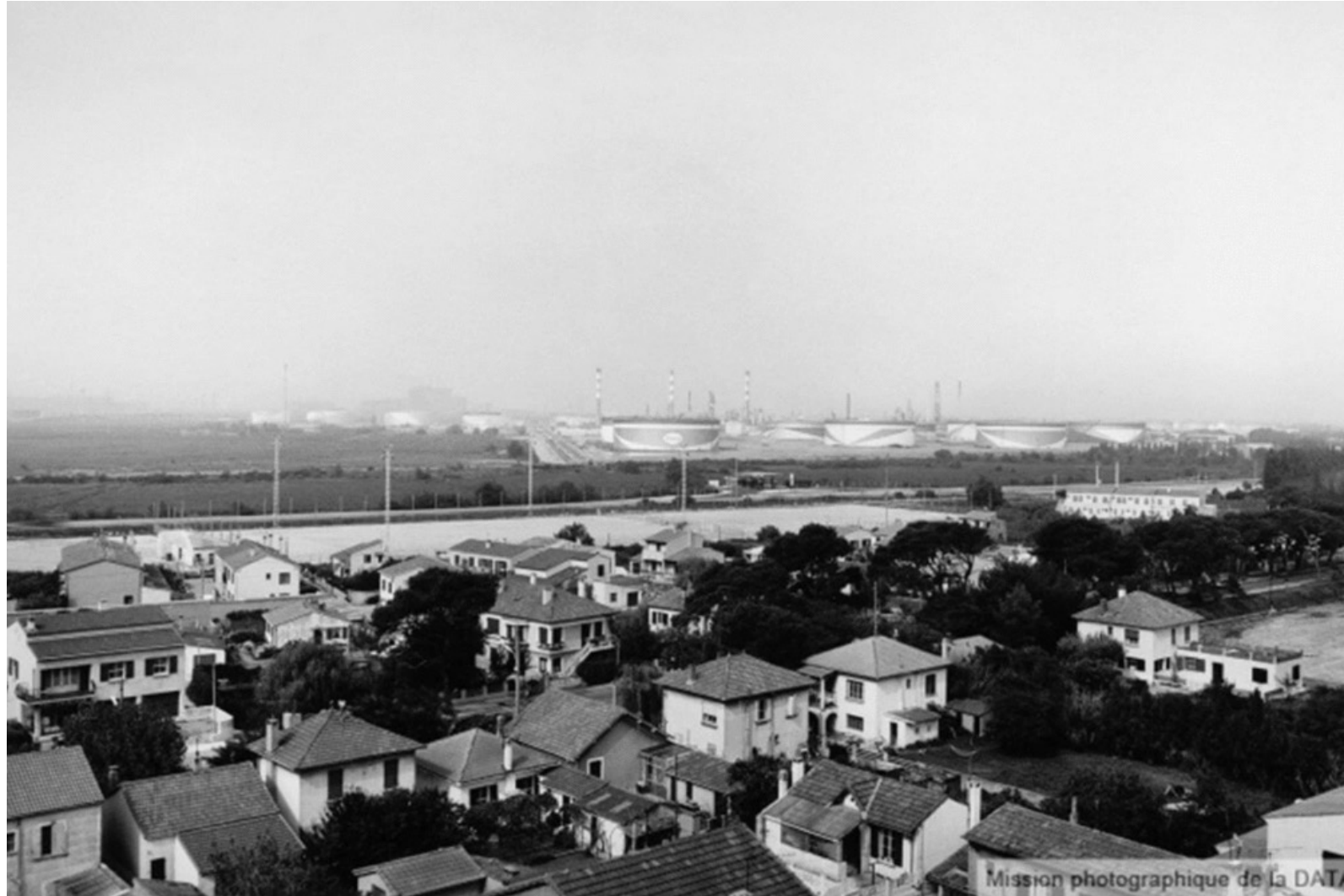
Lewis Baltz, Littoral urbanisé , Fos-sur-Mer

la mission photographique de la DATAR commanditée par l'Agence nationale de la cohésion des territoires (1984-1989)