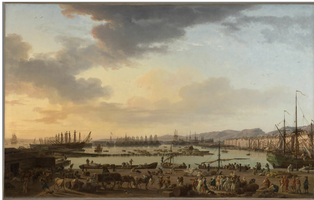
Le Port Vieux de Toulon , 1757, musée de la Marine, Paris.