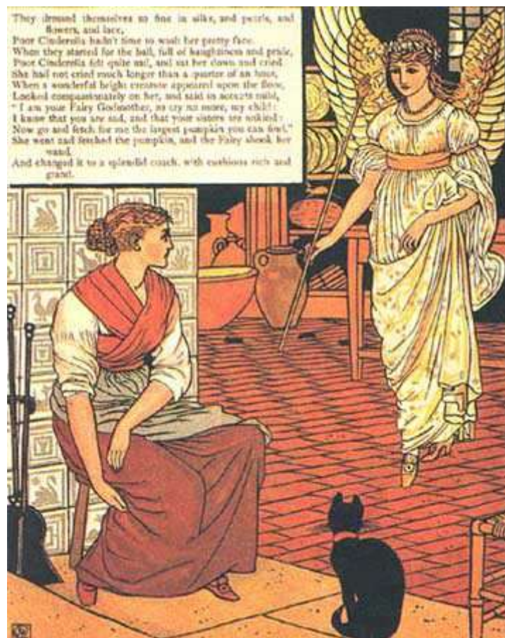
Dessin de Walter Crane

Alors l'oiseau lui lança une robe d'or et d'argent, ainsi que des pantoufles brodées de soie et d'argent. Elle mit la robe en toute hâte et partit à la fête. Ni ses sœurs, ni sa marâtre ne la reconnurent, et pensèrent que ce devait être la fille d'un roi étranger, tant elle était belle dans cette robe d'or. Elles ne songeaient pas le moins du monde à Cendrillon et la croyaient au logis, assise dans la saleté, à retirer les lentilles de la cendre. Le fils du roi vint à sa rencontre, a prit par la main et dansa avec elle. Il ne voulut même danser avec nulle autre, si bien qu'il ne lui lâcha plus la main et lorsqu'un autre danseur venait l'inviter, il lui disait : « C'est ma cavalière ».