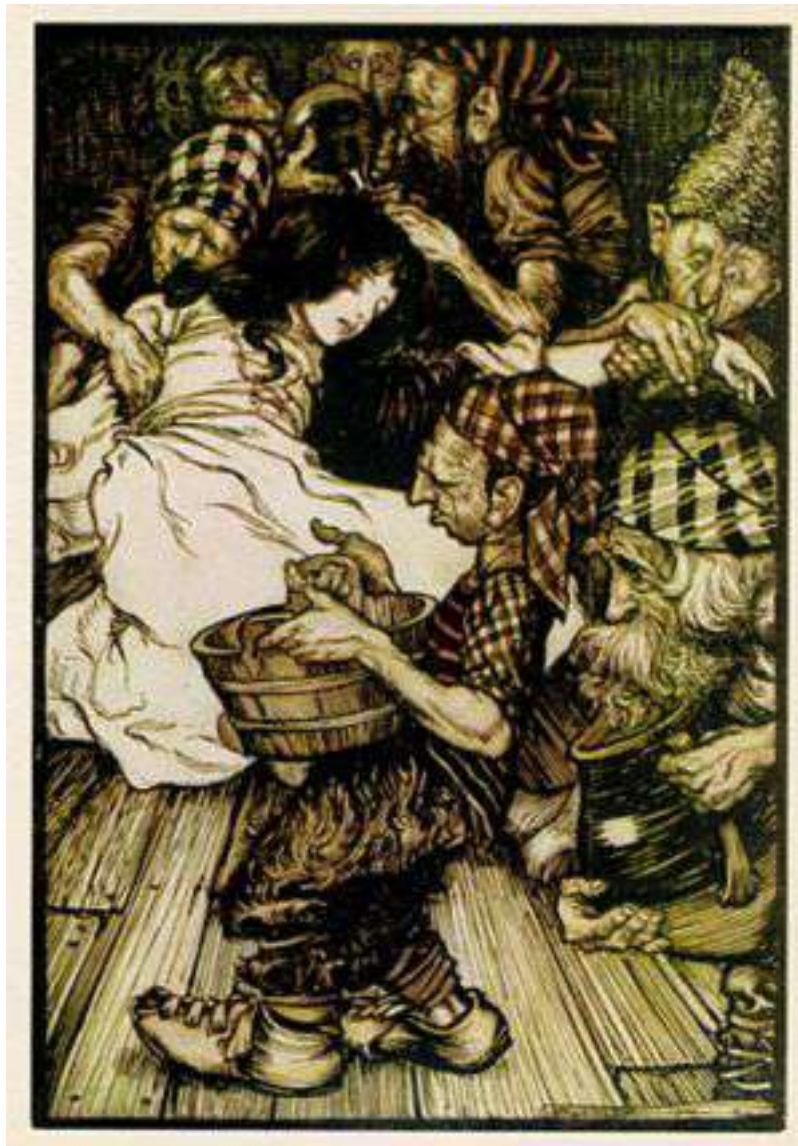
Dessin de Arthur Rackham

Le soir, en rentrant, les sept nains furent épouvantés à la vue de Blanche neige gisant à terre, sans vie. Apercevant le corselet tellement serré, ils coupèrent immédiatement les lacets. Blanche neige peu à peu revint à la vie.