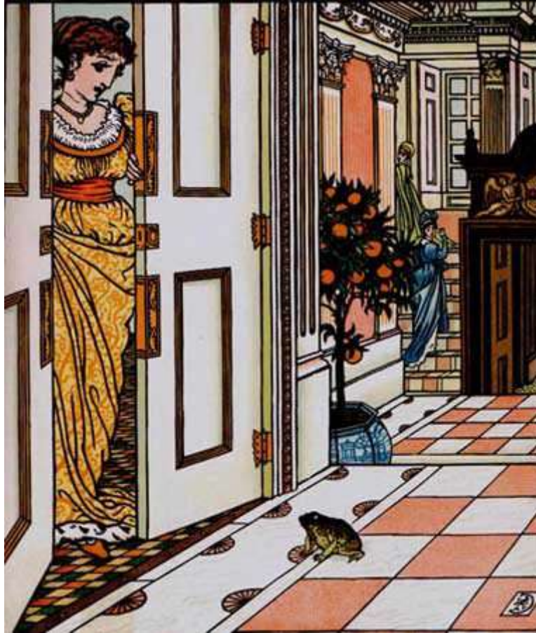
Dessin de Walter Crane

– Que crains-tu, mon enfant ? Y aurait-il un géant derrière la porte, qui viendrait te chercher ?