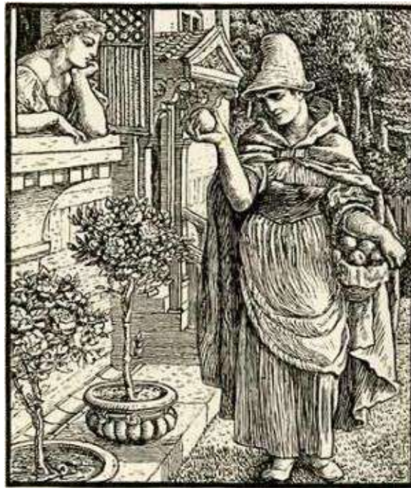
Dessin de Walter Crane