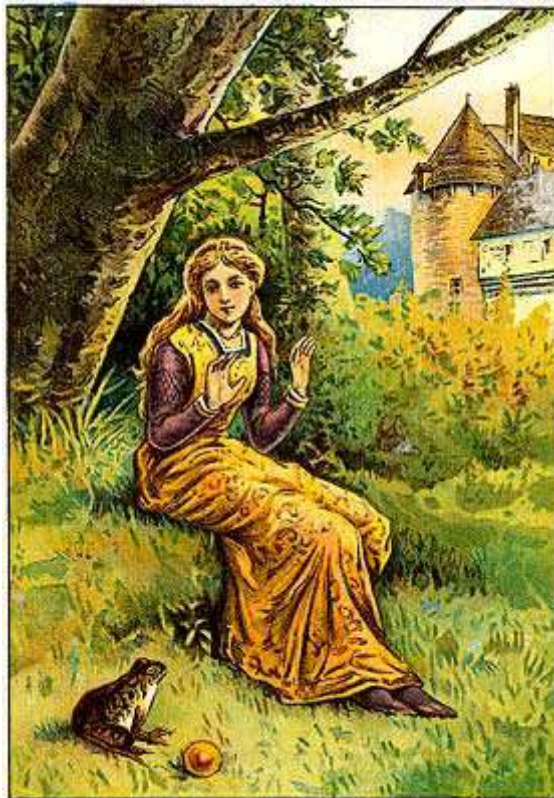
Dessin de Henry Altemus

Par deux fois encore, en cours de route, on entendit des craquements et le prince crut encore que la voiture se brisait. Mais ce n'était que les cercles de fer du fidèle Henri, heureux de voir son seigneur délivré.