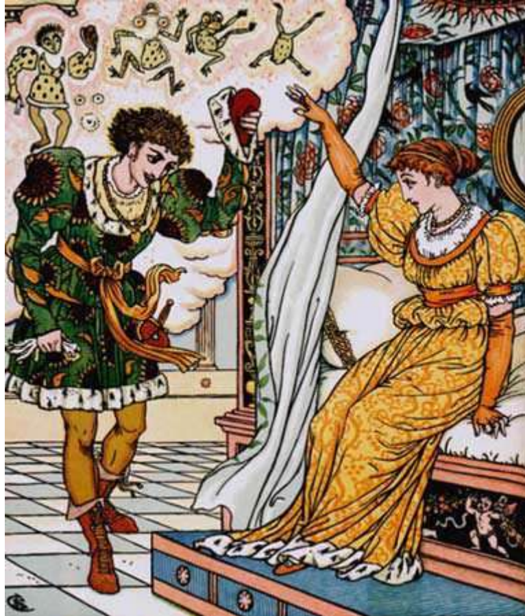
Dessin de Walter Crane

– Comme ça tu dormiras, affreuse grenouille !