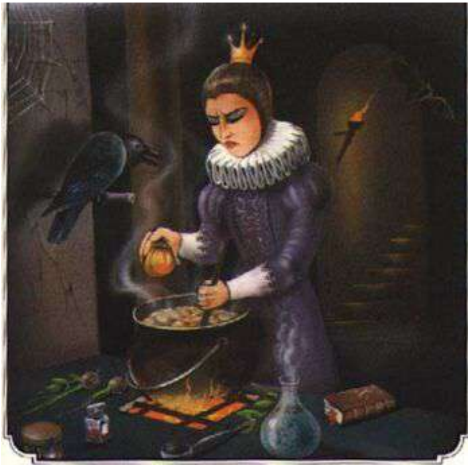
Dessin de Tuvia Kurtz

Cette réponse fit trembler la reine de rage et de jalousie. Elle jura que Blanche neige mourrait, dut-elle mourir elle-même. Elle alla dans son cabinet secret et prépara une pomme empoisonnée. Celle-ci était belle et appétissante. Cependant, il suffisait d'en manger un petit morceau pour mourir. La reine se maquilla, s'habilla en paysanne et partit pour le pays des sept nains. Arrivée à la maisonnette, elle frappa à la porte.