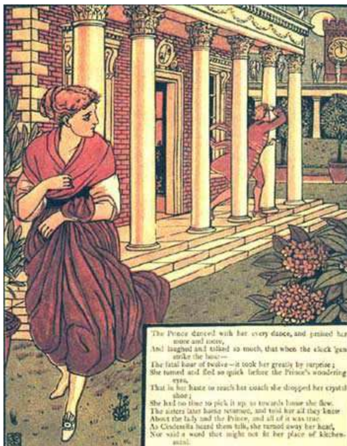
Dessin de Walter Crane

Le lendemain matin, il vint trouver le vieil homme avec la pantoufle et lui dit :