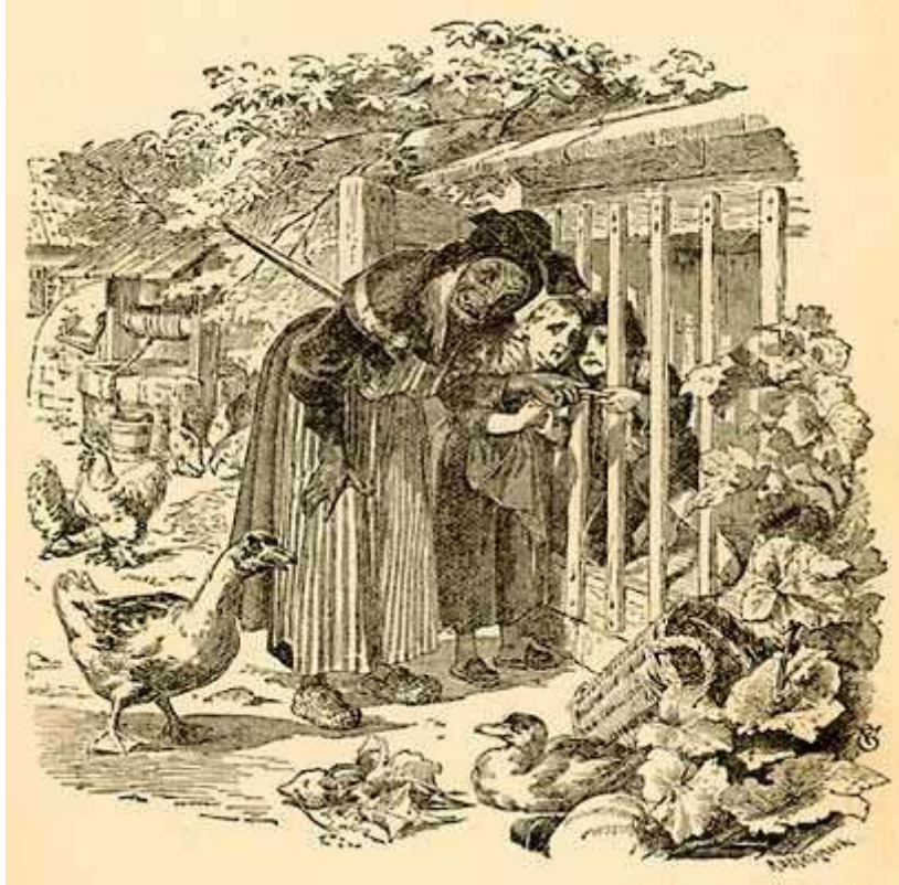
Dessin de Henry Altemus

– Holà ! Grethel, cria-t-elle, dépêche-toi d'apporter de l'eau. Que Hansel soit gras ou maigre, c'est demain que je le tuerai et le mangerai.