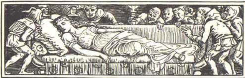
Dessin de Walter Crane

Ils la laissèrent dormir, la veillant avec amour.