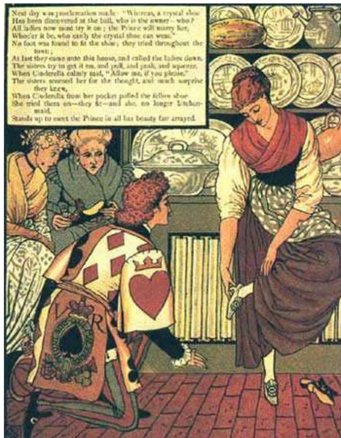
Dessin de Walter Crane

– Oh non ! la pauvre est bien trop sale pour se montrer.