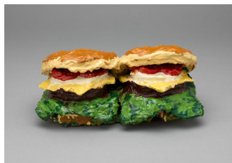
Claes Oldenburg, Two cheesburgers , 1962 (sculpture en plâtre), et Fourchette avec la boulette de viande et le spaghetti 1994