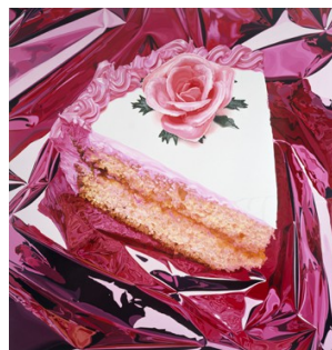
Jeff Koons, Cake , peinture hyperréaliste de 1995