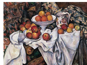
Paul Cézanne, Pommes et oranges , 1899