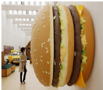
Tom Friedman, Big big mac , 2013