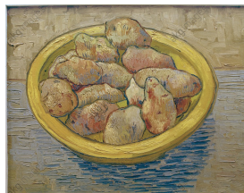
Vincent Van Gogh, Pommes de terre dans un plat jaune , 1888