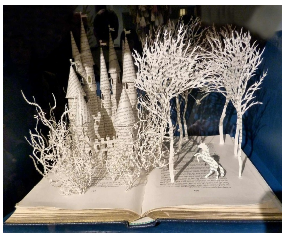
Su Blackwell , artiste anglaise née en 1975