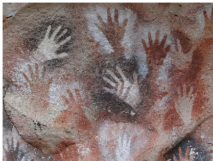
Peinture rupestre, Grotte de Lascaux