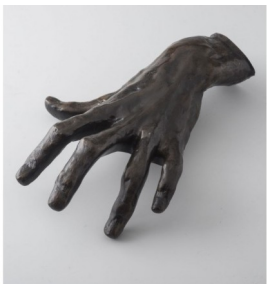
Auguste Rodin, Main dite « de pianiste », vers 1892