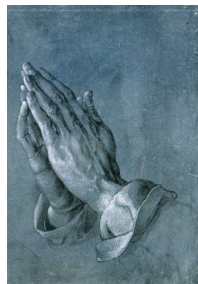
Mains en prière, Albrecht Dürer, 1508