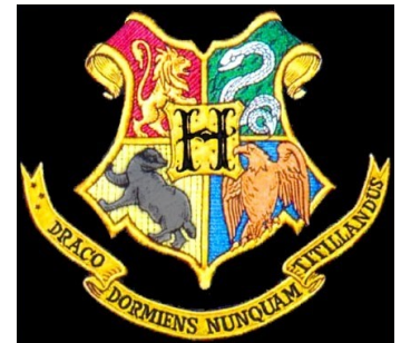
Emblème de Poudlard

Ce sont les dessins très diversifiés posés sur le blason. Leur place est variable, ils sont souvent stylisés. L'écu est divisé et peut avoir des formes très diverses, et les couleurs symbolisent les qualités de celui qui les porte. Par exemple : l'or, le soleil et la topaze : intelligence, grandeur, vertu, prestige. L'argent, la lune et la perle : netteté, pureté, sagesse.