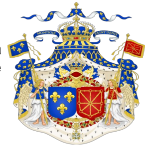
Blason de Louis XIV

Un blason c'est un signe d'identité , lié à un langage particulier : l'héraldique . La science héraldique étudie les armoiries et les blasons. Le blason est l'ensemble des couleurs et dessins apposés sur un écu (= emblème).