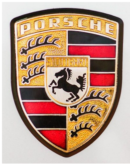
Emblème de la marque Porsche

Au début du Moyen-Age , les combats entre guerriers n'étaient que des mêlées confuses où il était difficile de reconnaître les amis des ennemis. Alors, les grands seigneurs se sont mis à porter des emblèmes personnels (drapeaux, enseignes) ; puis ils ont fait peindre sur leurs boucliers des dessins qui les représentaient : des dragons, des aigles, des lions , etc.. avec des couleurs bien différentes pour se faire reconnaître, un peu à la manière des jockeys ou des footballeurs d' aujourd'hui.